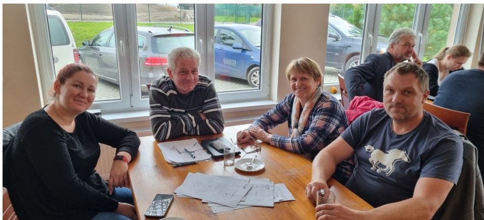
Zdjęcie nr 3 – Praca grupy podczas pierwszego dnia warsztatów

Pierwszego dnia warsztatów członkowie grupy pracowali nad określeniem analizy zasobów . Na podstawie tego dokumentu wskazywali elementy, które oceniają jako silne strony sołectwa i słabe – wymagające zmiany. Wskazywali również na to, jakie szanse i zagrożenia płyną z otoczenia zewnętrznego, które mogą zostać wykorzystane lub ograniczać rozwój sołectwa. W ten sposób przeprowadzono analizę SWOT - analizę, która identyfikuje i wskazuje silne i słabe strony sołectwa, oraz szanse i zagrożenia jakie mają oddziaływanie na sołectwo. Analiza ta uwzględniała poprzedni dokument, który obecnie uległ modyfikacji ze względu na realizację wcześniej zaplanowanych zadań i powstałych nowych oczekiwań mieszkańców do sytuacji panującej obecnie w sołectwie. Każda z wykazanych, obecnie występujących cech, została przypisana do jednego z obszarów potencjału rozwojowego. Są to: Standard życia, Jakość życia, Tożsamość wsi i wartości życia wiejskiego, a także Byt. Uczestnicy warsztatów przeprowadzili również analizę potencjału rozwojowego . Pozwoliło to wskazać najważniejsze cele ogólne oraz zaplanować rozwój tak, aby był on równomierny i wykorzystywał wszystkie obszary interwencji. Finalnie Grupa Odnowy Wsi wskazała wizję hasłową i wizję opisową sołectwa.