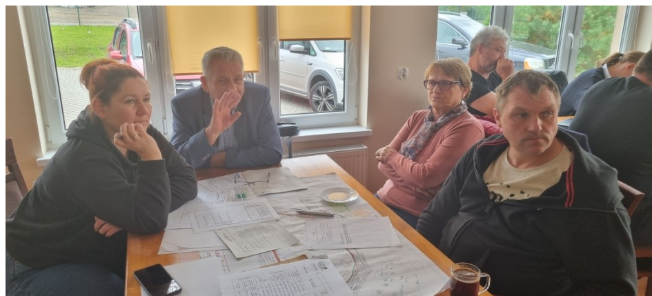
Zdjęcie nr 4 – Praca grupy podczas drugiego dnia warsztatów