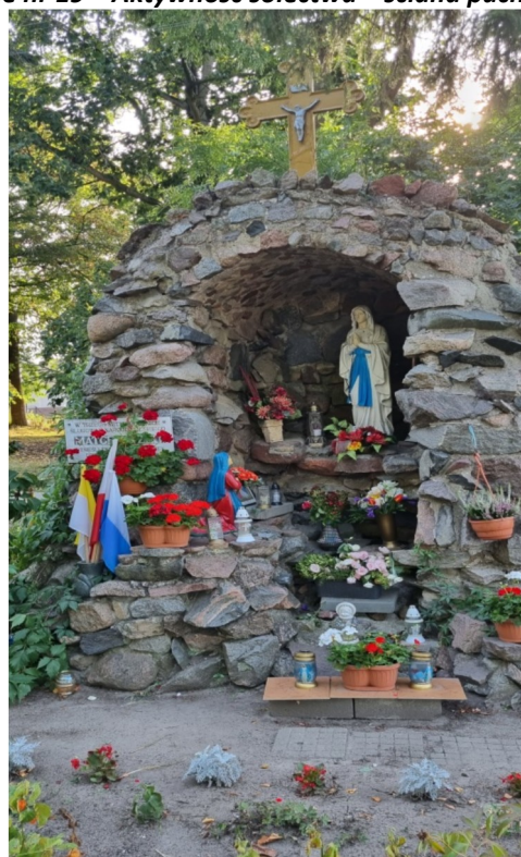
Zdjęcie nr 20 – Grota – obiekt kultu religijnego