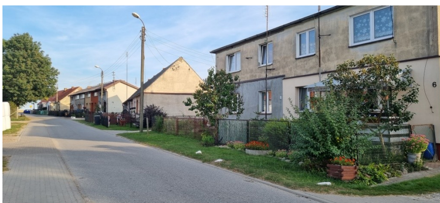
Zdjęcie nr 2 – Zabudowania przy drodze w miejscowości

Opracowanie Sołeckiej Strategii Rozwoju było skutkiem przeprowadzenia dwudniowych warsztatów , które poprzedzone zostały wizytacją miejscowości przez moderatorów.