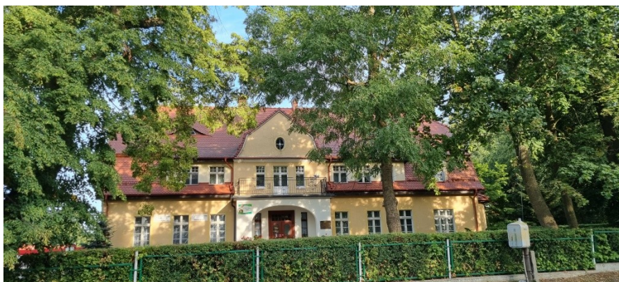
Zdjęcie nr 5 – Charakterystyczny zabytkowy budynek w miejscowości – siedziba firmy prywatnej

Najwcześniejsze wzmianki o Dobrzyniewie sięgają 1471 roku, i są zawarte w: „Słowniku geograficznym Królestwa Polskiego”, można tam przeczytać: „Dobrzyniewo – niemiecka nazwa Dobbertin, nazwa własna, powiat wyrzyski, w 1471 roku miejscowość rozłączona najprawdopodobniej od Falmierowa, zawierająca 14 domów murowanych, 192 mieszkańców, 41 mężczyzn i 151 kobiet i dzieci, 93 osoby nie umiejące czytać i pisać, stacja pocztowa o 4 kilometry, stacja kolejowa żelazna oddalona od Osieka nad Notecią o 9 kilometrów, do 1939 roku było własnością rodziny niemieckiej E.Kujathy.”