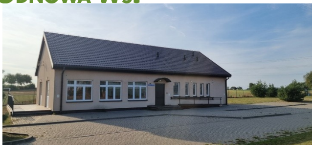
Zdjęcie nr 7 – Sala wiejska w miejscowości