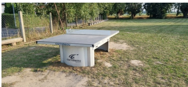
Zdjęcie nr 11 – Zewnętrzny stół do tenisa stołowego