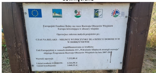
Zdjęcie nr 10 – Źródła finansowania placu zabaw