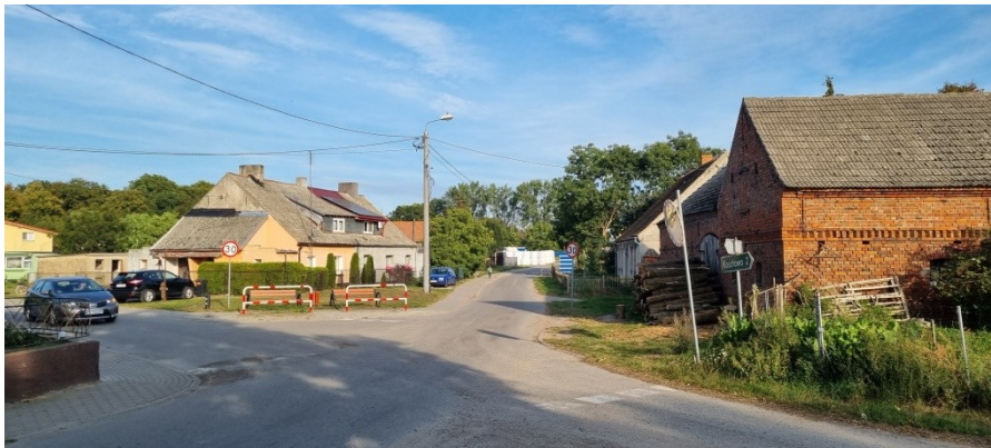
Zdjęcie nr 6 –Centrum miejscowości – zbudowania przy drodze

W 2014 roku, wieś zyskała świetlicę wiejską, projekt zrealizowany przy wsparciu Programu Rozwoju Obszarów Wiejskich(perspektywa 2007-2013) i od tego czasu można zaobserwować wzrost aktywności lokalnej społeczności. W 2021 roku, po 17 latach przerwy reaktywowało swoją działalność Koło Gospodyń Wiejskich, które aktywnie działa na rzecz lokalnej społeczności.