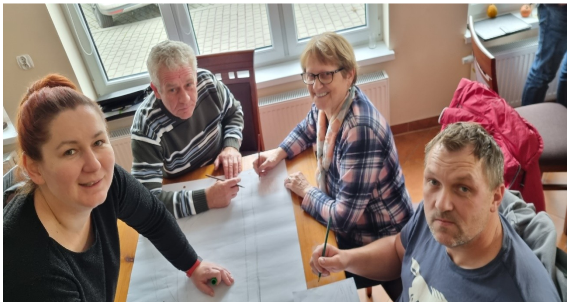
Zdjęcie 23 Praca przedstawicieli GOW nad stworzeniem wizji obrazkowej