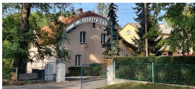
Zdjęcie nr 14 – Fasada zabytkowych budynków