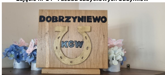
Zdjęcie nr 16 – Element promocyjny KGW