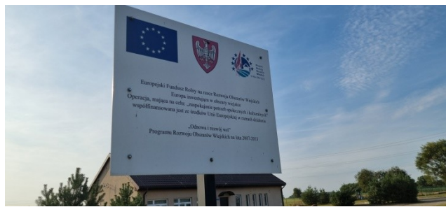
Zdjęcie nr 8 – Tablica promująca pozyskane środki zewnętrzne