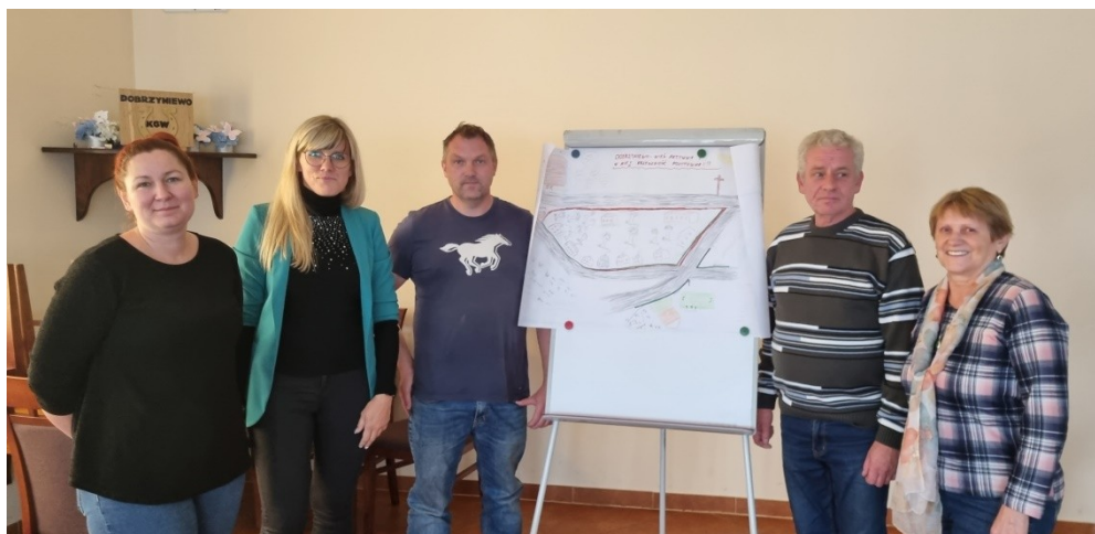
Zdjęcie 21 Prezentacja wizji obrazkowej miejscowości