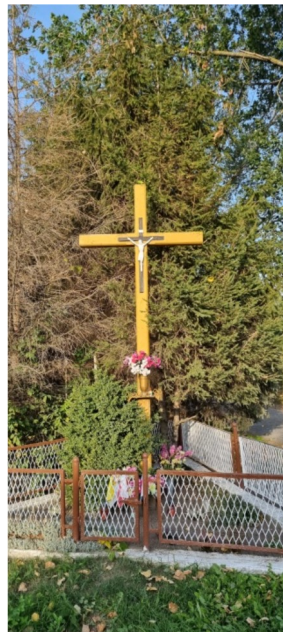
Zdjęcie nr 18 – Krzyż przydrożny