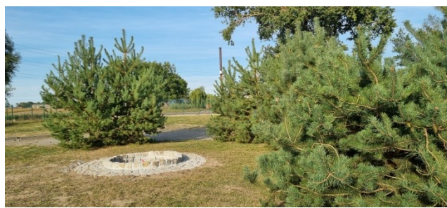
Zdjęcie nr 12 – Miejsce na ognisko