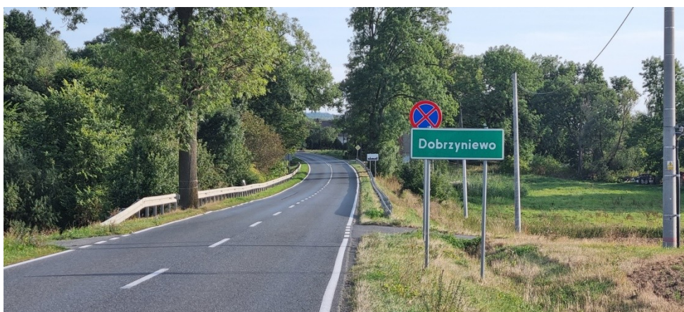
Zdjęcie nr 1 – Wjazd do miejscowości