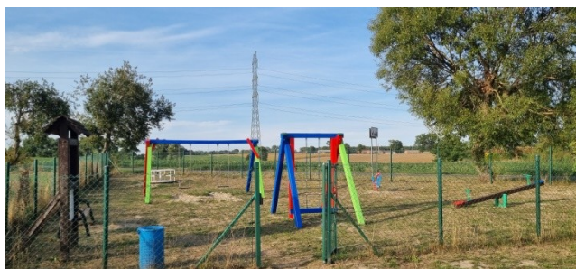
Zdjęcie nr 9 – Plac zabaw