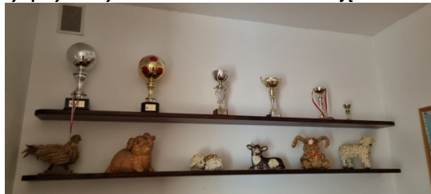
Zdjęcie nr 19 – Aktywność sołectwa – ściana pucharowa