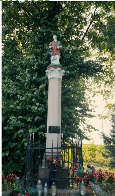
Zdjęcie nr 17 – Krzyż przydrożny