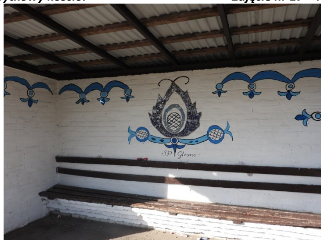
Zdjęcie nr 18 – wzory krajeńskie – wykonane przez mieszkańców na przystanku autobusowym