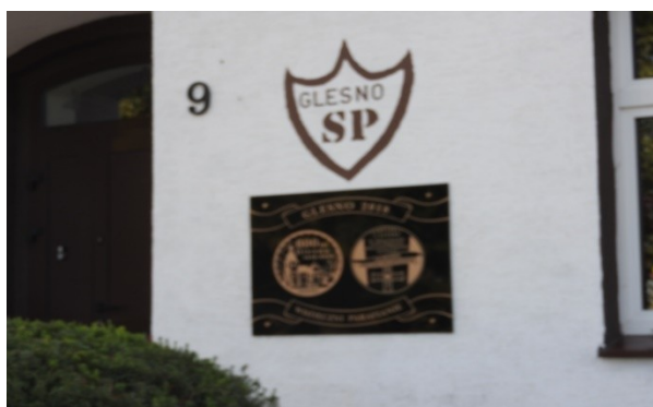
Zdjęcie nr 15 – Identyfikacja budynku szkolnego