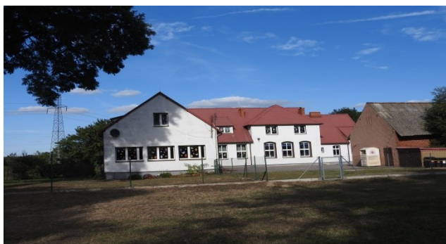
Zdjęcie nr 8 – Szkoła podstawowa w Gleśnie