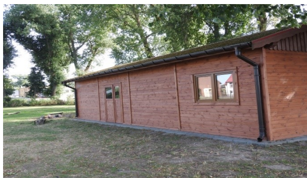
Zdjęcie nr 9 – Wiata na terenie rekreacyjnym – pełniąca rolę świetlicy wiejskiej