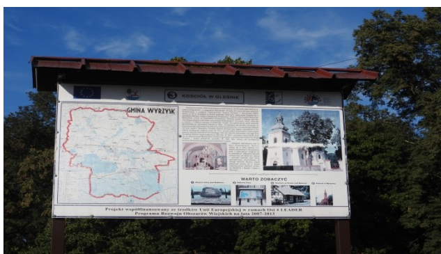
Zdjęcie nr 14 – Tablica informacyjna