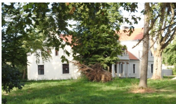
Zdjęcie nr 6 – Zabytkowy pałac w Bagdadzie

Przy dworku w Gleśnie jest zabytkowy park z pomnikami przyrody: potężnymi dębami, platanami i alejką bukową. Na terenie sołectwa znajdują się trzy jeziora: Parkowe, Konieczko i Gleszczonek. Z jezior tych wędkarze wyciągają nawet 10 kilogramowe karpie. W Gleśnie jest czteroklasowa Szkoła Podstawowa im. Janusza Korczaka, która istnieje 162 lata. W szkole prężnie działa kółko teatralne, muzyczne, klasa krajeńska, 10 GZ „Czerwone Muchomorki” i 9 DH „Wędrowcy”. Z powodu braku świetlicy całe życie kulturalne odbywa się w szkole. Szkoła organizuje imprezy kulturalne dla mieszkańców sołectwa. W wioskach należących do sołectwa budynkami mieszkalnymi są dawne czworaki, tylko w Gleśnie znajduje się również sześć bloków i w Bagdadzie trzy. Bloki te wybudowano w latach 70 i 80 ubiegłego wieku.