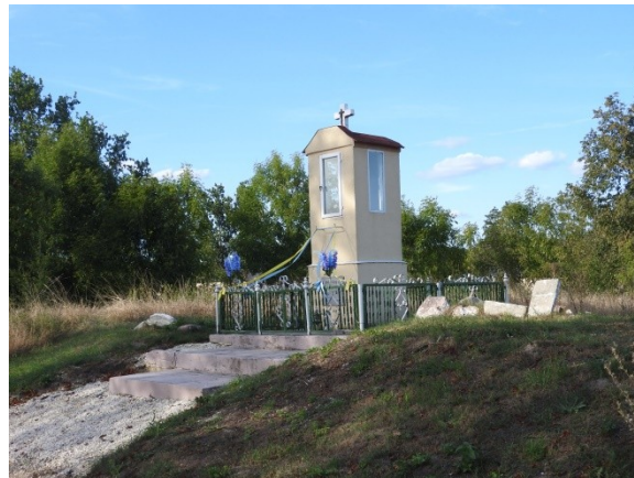
Zdjęcie nr 17 – Kapliczka przydrożna