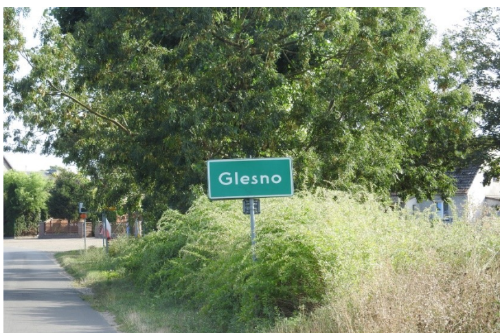
Zdjęcie nr 1 – Wjazd do miejscowości