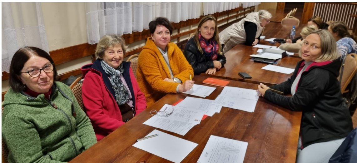
Zdjęcie nr 3 – Praca grupy podczas pierwszego dnia warsztatów

Pierwszego dnia warsztatów członkowie grupy pracowali nad określeniem analizy zasobów . Na podstawie tego dokumentu wskazywali elementy, które oceniają jako silne strony sołectwa i słabe – wymagające zmiany. Wskazywali również na to, jakie szanse i zagrożenia płyną z otoczenia zewnętrznego, które mogą zostać wykorzystane lub ograniczać rozwój sołectwa. W ten sposób przeprowadzono analizę SWOT - analizę, która identyfikuje i wskazuje silne i słabe strony sołectwa, oraz szanse i zagrożenia jakie mają oddziaływanie na sołectwo. Analiza ta uwzględniała poprzedni dokument, który obecnie uległ modyfikacji ze względu na realizację wcześniej zaplanowanych zadań i powstałych nowych oczekiwań mieszkańców do sytuacji panującej obecnie w sołectwie. Każda z wykazanych, obecnie występujących cech, została przypisana do jednego z obszarów potencjału rozwojowego. Są to: Standard życia, Jakość życia, Tożsamość wsi i wartości życia wiejskiego, a także Byt. Uczestnicy warsztatów przeprowadzili również analizę potencjału rozwojowego . Pozwoliło to wskazać najważniejsze cele ogólne oraz zaplanować rozwój tak, aby był on równomierny i wykorzystywał wszystkie obszary interwencji. Finalnie Grupa Odnowy Wsi wskazała wizję hasłową i wizję opisową sołectwa.