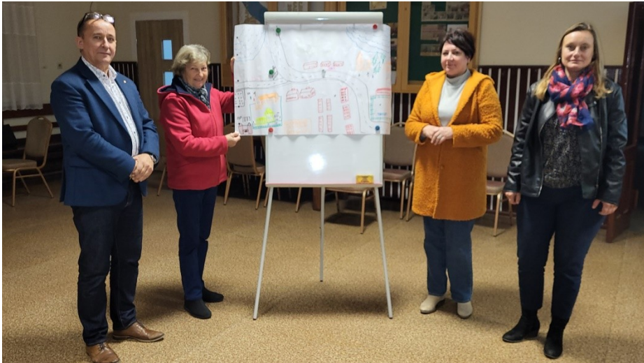
Zdjęcie 19 Prezentacja wizji obrazkowej miejscowości