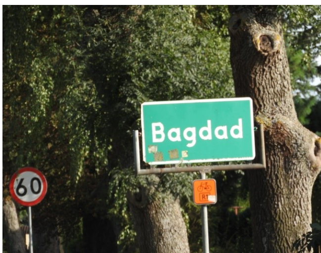
Zdjęcie nr 5 – Tablica informacyjna – jedna w miejscowości sołectwa

W skład sołectwa Glesno wchodzi wsie: Bagdad, Bielawy Nowe, Glesno, Gleszczonek i Marynka. W sołectwie znajduje się tylko sześć gospodarstw indywidualnych, pozostałe ziemie zajmuje Stadnina Koni w Dobrzniewie, Gospodarstwo Glesno i 100 h Parafia pw. Św. Jadwigi w Gleśnie. Ziemie te kiedyś należały do właścicieli ziemskich: Smoguleckich, Goślawskich, Korytowskich, Trąpczyńskich, Bnińskich, a od roku 1899 do 1939 do rodziny Chłapowskich. Zabytkowe dworki, pozostałość po właścicielach ziemskich, znajdują się w Bagdadzie, Gleśnie i Marynce.