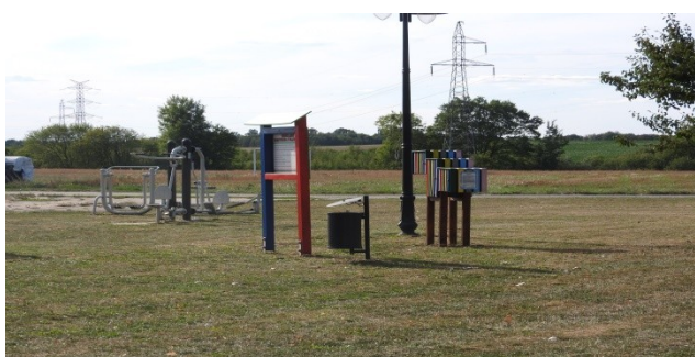
Zdjęcie nr 10 Siłownia zewnętrzna na terenie rekreacyjnym