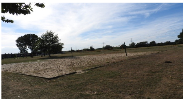
Zdjęcie nr 12 – Boisko do piłki siatkowej plażowej