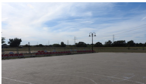
Zdjęcie nr 13 – Boisko wielofunkcyjne