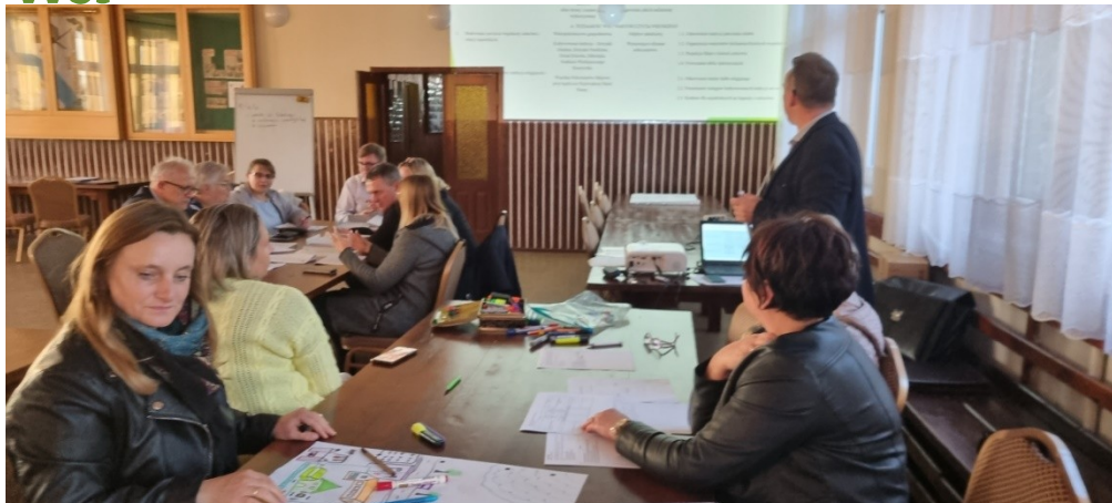
Zdjęcie nr 4 – Praca grupy podczas drugiego dnia warsztatów

Drugiego dnia warsztatów mieszkańcy zobowiązani byli wskazać, na podstawie przeprowadzonych wcześniejszych analiz w poszczególnych obszarach rozwojowych sołectwa, planowane zamierzenia projektowe. Tak powstał plan długo i krótkoterminowy rozwoju sołectwa Glesno na najbliższy rok i 5-lat. W planie krótkoterminowym wskazano te projekty/zadania, które mieszkańcy sołectwa planują zrealizować w pierwszej kolejności – w okresie 12 miesięcy. Następnie w ramach planu długoterminowego zaplanowano zadania na lata przyszłe. W planie długoterminowym wskazano cele jakie sołectwo określiło dla realizacji Wizji Rozwoju Sołectwa . Cele zostały postawione w poszczególnych obszarach interwencji, które Grupa Odnowy Wsi postanowiła osiągnąć poprzez realizację zadań i projektów zapisanych w planie długoterminowym i programie krótkoterminowym.