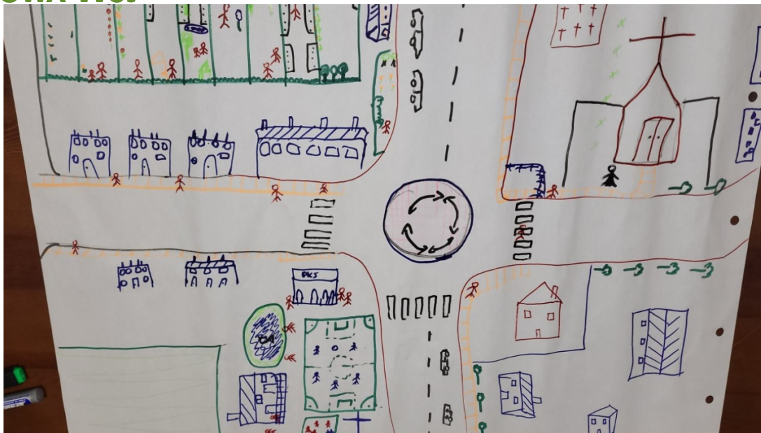
Zdjęcie 20 Wizja obrazkowa miejscowości wykonana podczas warsztatów przez Przedstawicieli GOW