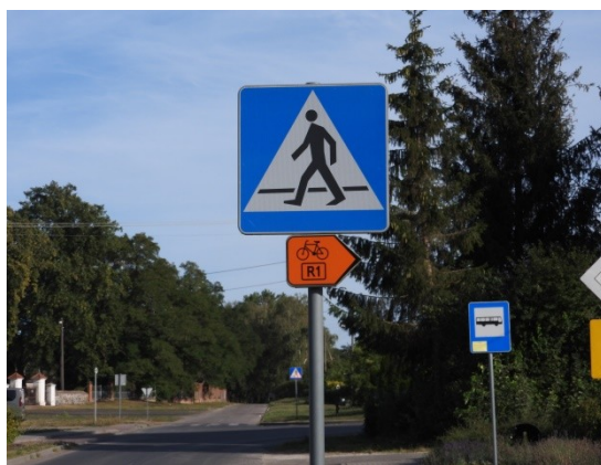
Zdjęcie nr 7 – Oznakowanie trasy rowerowej R1