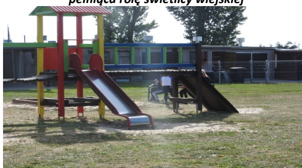
Zdjęcie nr 11 – Elementy placu zabaw