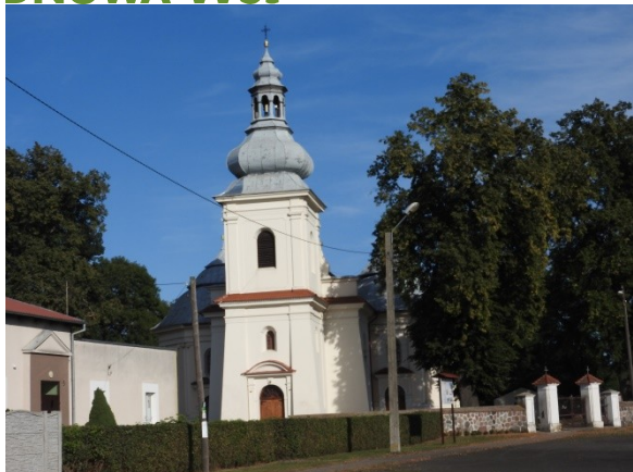
Zdjęcie 16 - Zabytkowy kościół