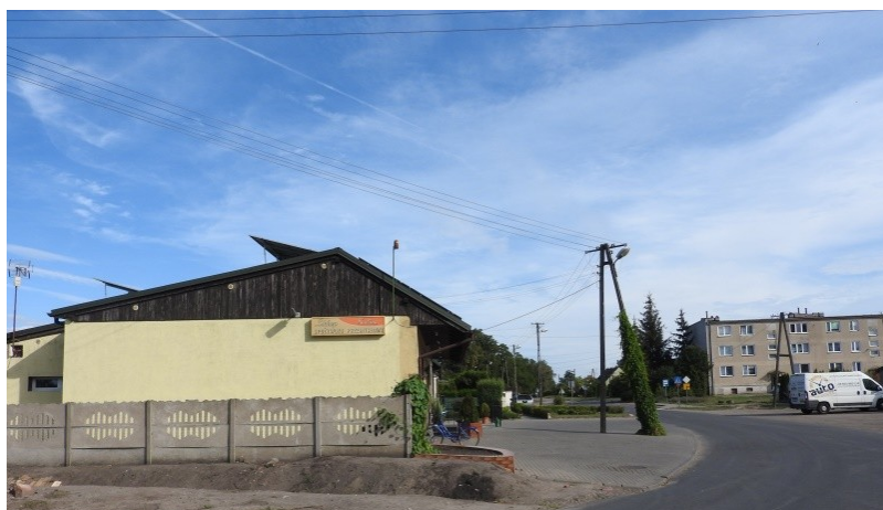
Zdjęcie nr 2 – Zabudowania przy drodze w miejscowości

Opracowanie Sołeckiej Strategii Rozwoju było skutkiem przeprowadzenia dwudniowych warsztatów , które poprzedzone zostały wizytacją miejscowości przez moderatorów.