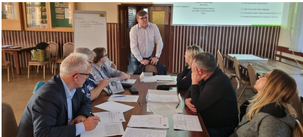
Zdjęcie nr 4 – Praca grupy podczas drugiego dnia warsztatów