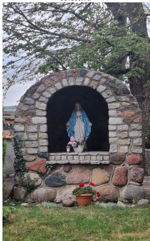
Zdjęcie nr 19 – Miejsce kultury religijnego – grotta z figurą Matki Boskiej