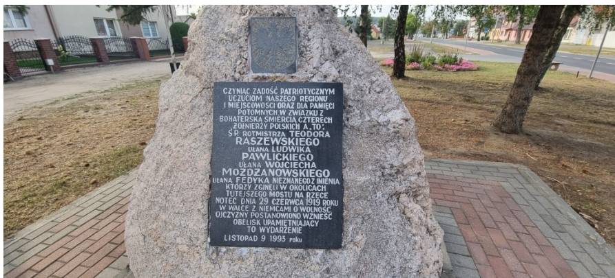
Zdjęcie nr 5 – Charakterystyczny kamień upamiętniający wydarzenia historyczne

Osiek nad Notecią to jedna z największych wsi w regionie i zdecydowanie największa w Gminie Wyrzysk. Obecnie liczy około 3700 mieszkańców. Wieś położona jest na skraju doliny Noteci oddzielając Pojezierze Wielkopolskie od Pojezierza Pomorskiego. Od wschodu graniczy z rzeką Łobżonką. Przez wieś przebiega droga wojewódzka 242 oraz szlak rowerowy R1 wiodący z francuskiego Calais do Petersburga w Rosji.