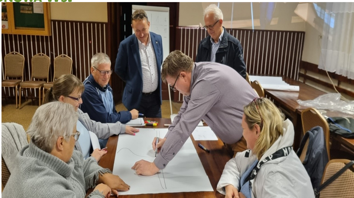
Zdjęcie 21 Praca przedstawicieli GOW nad stworzeniem wizji obrazkowe