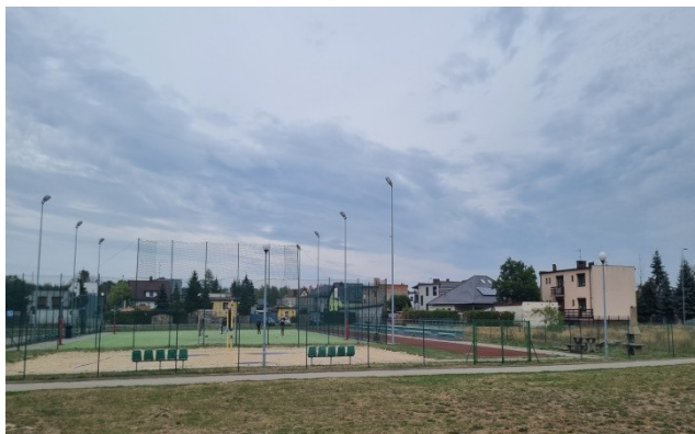
Zdjęcie nr 13 – Boisko wielofunkcyjne