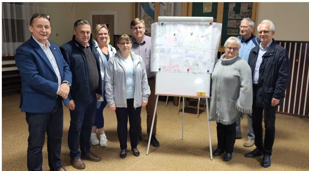
Zdjęcie 20 Prezentacja wizji obrazkowej miejscowości