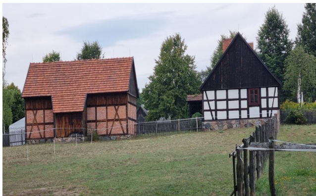
Zdjęcie nr 12 – Zabytkowe budynki na terenie Skansenu