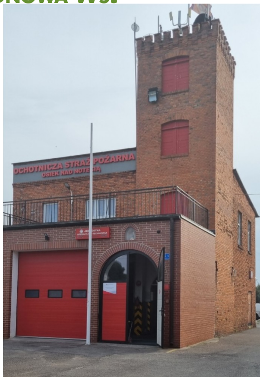
Zdjęcie nr 16 – Remiza OSP