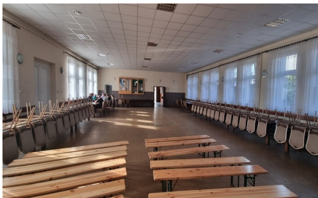
Zdjęcie nr 8 – Sala wiejska w miejscowości – wnętrze