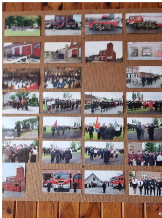
Zdjęcie nr 17 – Dokumentacja fotograficzna aktywności sołectwa