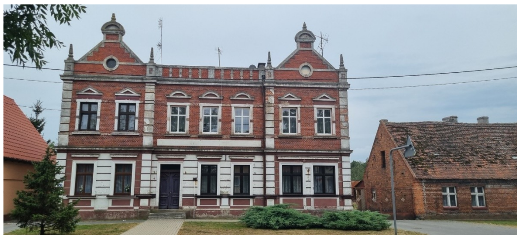
Zdjęcie nr 6 – Centrum miejscowości – charakterystyczne zbudowania z czerwonej cegły