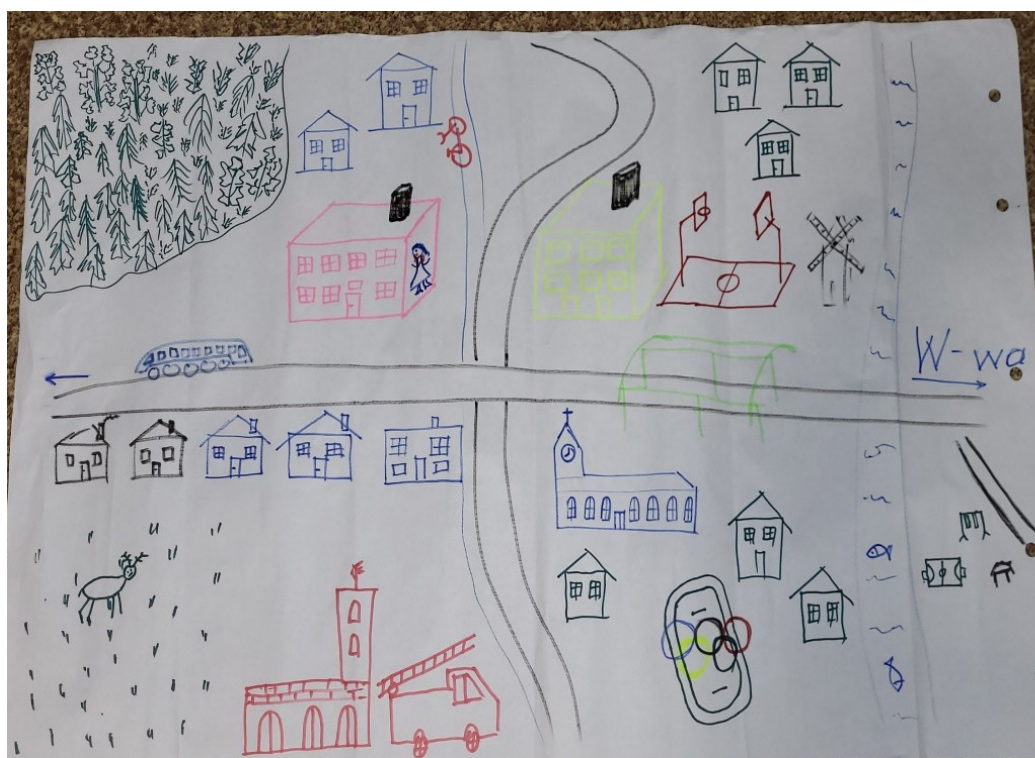
Zdjęcie 21 Wizja obrazkowa miejscowości wykonana podczas warsztatów przez Przedstawicieli GOW

Osiek jest atrakcyjny turystycznie dzięki skansenowi i licznym atrakcją wykorzystującym lokalne zasoby.