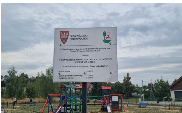
Zdjęcie nr 11 – Tablica informacyjna przy placu zabaw