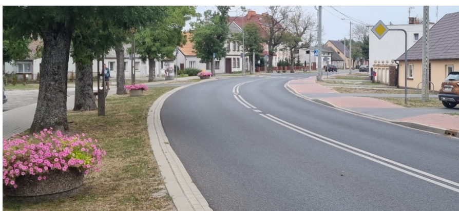
Zdjęcie nr 2 – Zabudowania przy drodze wojewódzkiej w miejscowości

Opracowanie Sołeckiej Strategii Rozwoju było skutkiem przeprowadzenia dwudniowych warsztatów , które poprzedzone zostały wizytacją miejscowości przez moderatorów.