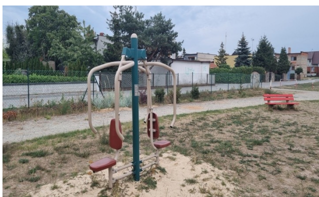
Zdjęcie nr 10 – Plac zabaw