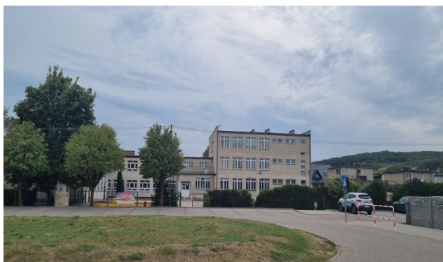
Zdjęcie nr 15 – Szkoła Podstawowa