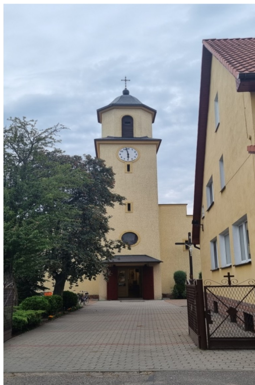
Zdjęcie nr 18 – Kościół pw. Św. Józefa