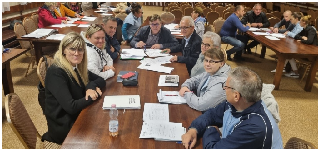
Zdjęcie nr 3 – Praca grupy podczas pierwszego dnia warsztatów

Pierwszego dnia warsztatów członkowie grupy pracowali nad określeniem analizy zasobów . Na podstawie tego dokumentu wskazywali elementy, które oceniają jako silne strony sołectwa i słabe – wymagające zmiany. Wskazywali również na to, jakie szanse i zagrożenia płyną z otoczenia zewnętrznego, które mogą zostać wykorzystane lub ograniczać rozwój sołectwa. W ten sposób przeprowadzono analizę SWOT - analizę, która identyfikuje i wskazuje silne i słabe strony sołectwa, oraz szanse i zagrożenia jakie mają oddziaływanie na sołectwo. Analiza ta uwzględniała poprzedni dokument, który obecnie uległ modyfikacji ze względu na realizację wcześniej zaplanowanych zadań i powstałych nowych oczekiwań mieszkańców do sytuacji panującej obecnie w sołectwie. Każda z wykazanych, obecnie występujących cech, została przypisana do jednego z obszarów potencjału rozwojowego. Są to: Standard życia, Jakość życia, Tożsamość wsi i wartości życia wiejskiego, a także Byt. Uczestnicy warsztatów przeprowadzili również analizę potencjału rozwojowego . Pozwoliło to wskazać najważniejsze cele ogólne oraz zaplanować rozwój tak, aby był on równomierny i wykorzystywał wszystkie obszary interwencji. Finalnie Grupa Odnowy Wsi wskazała wizję hasłową i wizję opisową sołectwa.