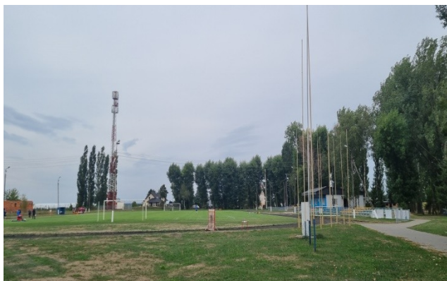
Zdjęcie nr 9 – Stadion sportowy