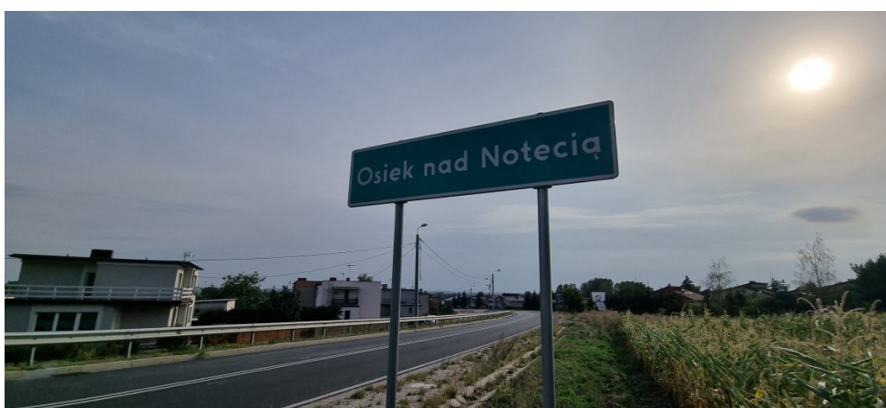
Zdjęcie nr 1 – Wjazd do miejscowości