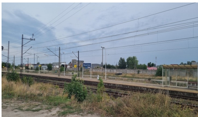
Zdjęcie nr 14 – Trasa kolejowa – przystanek Wyrzysk-Osiek