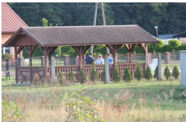
Zdjęcie nr 9 – Wiata integracyjna