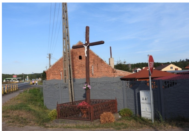
Zdjęcie nr 10 – Krzyż przydrożny