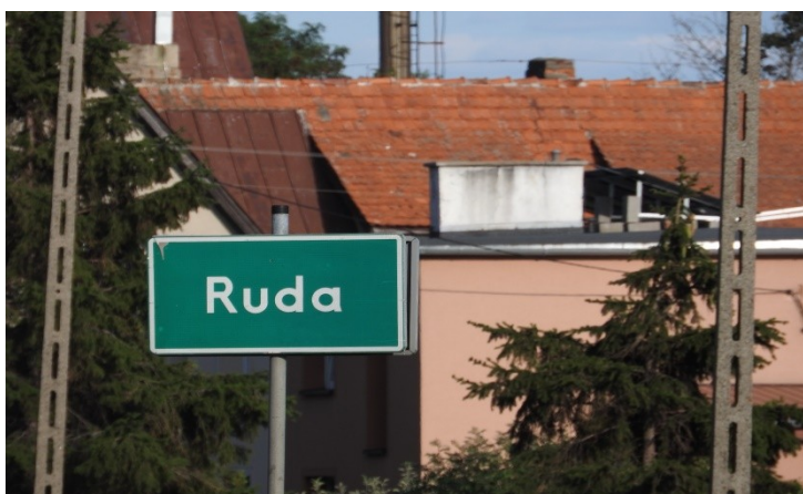
Zdjęcie nr 1 – Wjazd do miejscowości