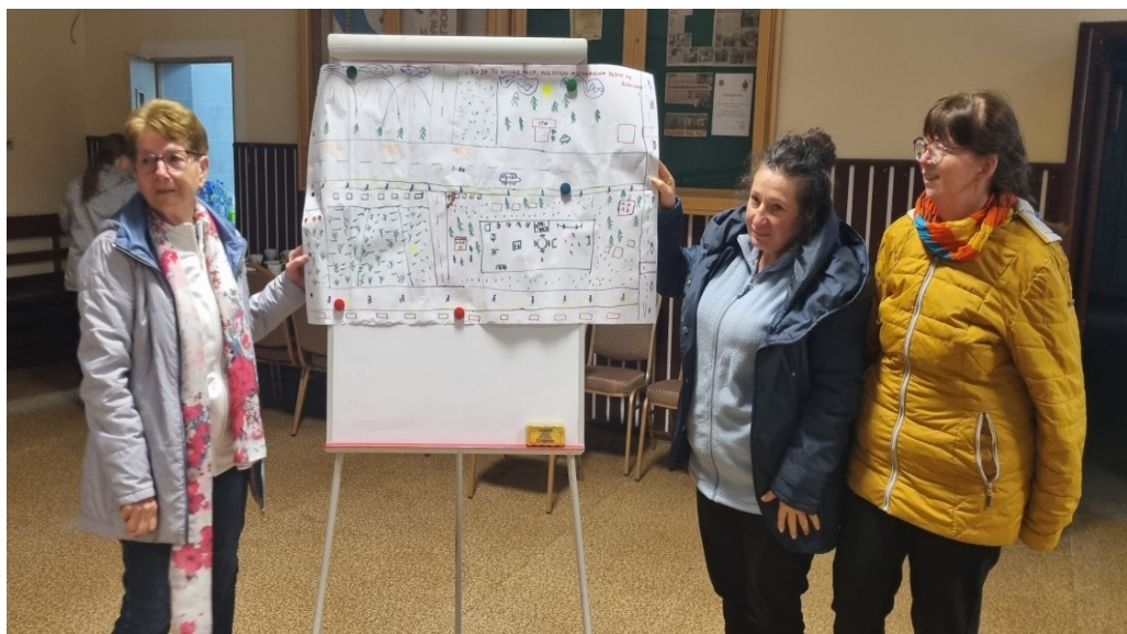
Zdjęcie 19 Prezentacja wizji obrazkowej miejscowości