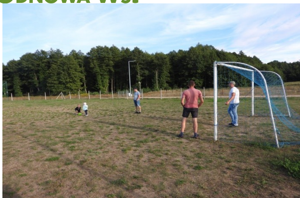
Zdjęcie nr 5 – Boisko piłkarskie