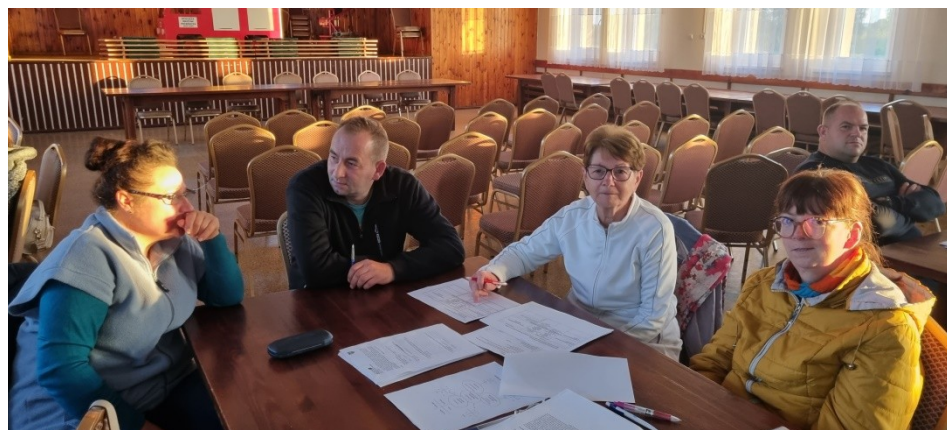
Zdjęcie nr 4 – Praca grupy podczas drugiego dnia warsztatów