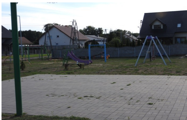
Zdjęcie nr 7 – Plac zabaw i utwardzenie przy koszu do koszykówki