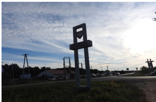
Zdjęcie nr 12 – Witacz na granicy województw