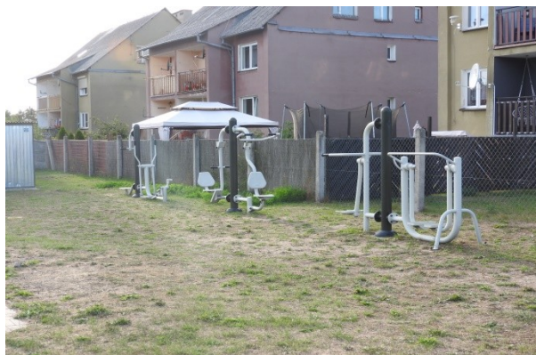
Zdjęcie nr 6 – Urządzenia siłowni zewnętrznej