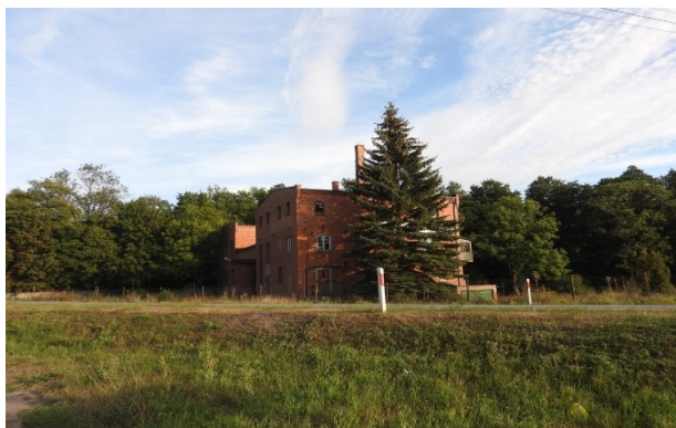
Zdjęcie nr 11 – Pozostałości po starej zabudowie Gorzelni