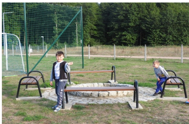
Zdjęcie nr 8 – Miejsce na ognisko