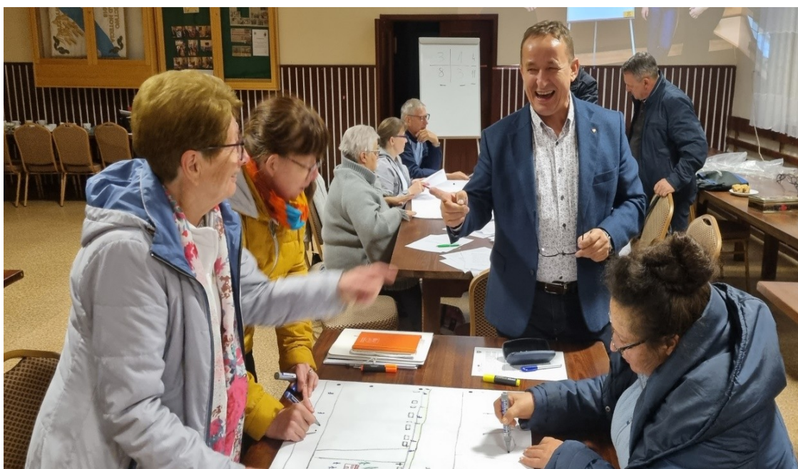
Zdjęcie 21 Praca przedstawicieli GOW nad stworzeniem wizji obrazkowej