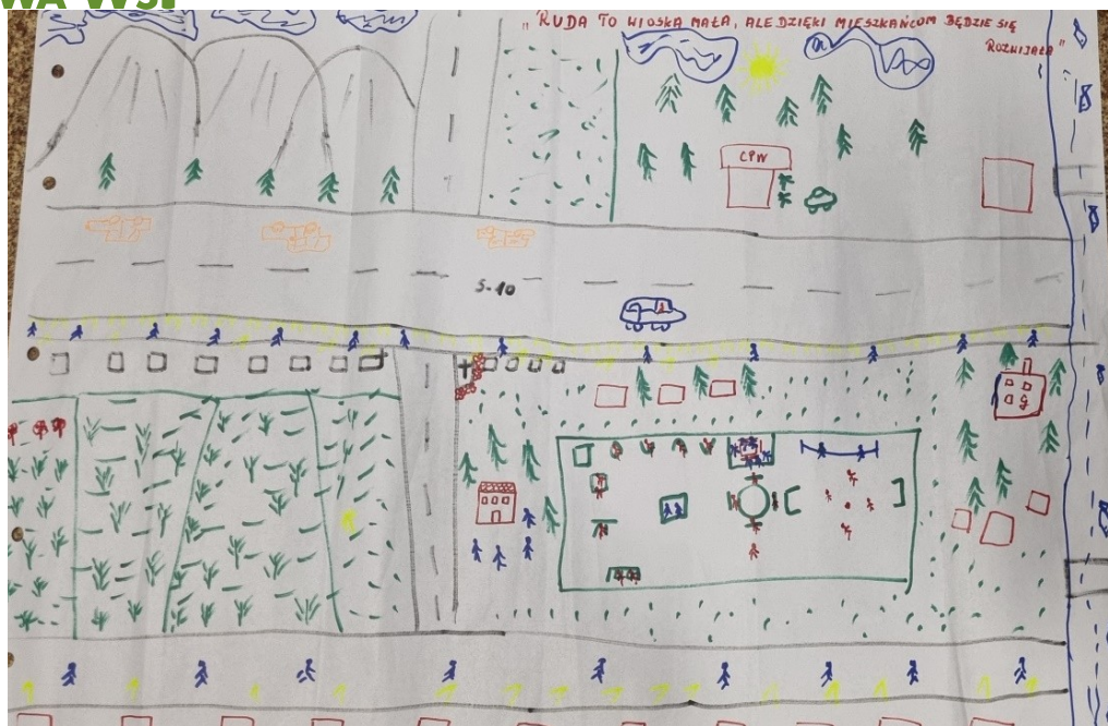
Zdjęcie 20 Wizja obrazkowa miejscowości wykonana podczas warsztatów przez Przedstawicieli GOW