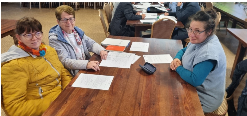
Zdjęcie nr 3 – Praca grupy podczas pierwszego dnia warsztatów

Pierwszego dnia warsztatów członkowie grupy pracowali nad określeniem analizy zasobów . Na podstawie tego dokumentu wskazywali elementy, które oceniają jako silne strony sołectwa i słabe – wymagające zmiany. Wskazywali również na to, jakie szanse i zagrożenia płyną z otoczenia zewnętrznego, które mogą zostać wykorzystane lub ograniczać rozwój sołectwa. W ten sposób przeprowadzono analizę SWOT - analizę, która identyfikuje i wskazuje silne i słabe strony sołectwa, oraz szanse i zagrożenia jakie mają oddziaływanie na sołectwo. Analiza ta uwzględniała poprzedni dokument, który obecnie uległ modyfikacji ze względu na realizację wcześniej zaplanowanych zadań i powstałych nowych oczekiwań mieszkańców do sytuacji panującej obecnie w sołectwie. Każda z wykazanych, obecnie występujących cech, została przypisana do jednego z obszarów potencjału rozwojowego. Są to: Standard życia, Jakość życia, Tożsamość wsi i wartości życia wiejskiego, a także Byt. Uczestnicy warsztatów przeprowadzili również analizę potencjału rozwojowego . Pozwoliło to wskazać najważniejsze cele ogólne oraz zaplanować rozwój tak, aby był on równomierny i wykorzystywał wszystkie obszary interwencji. Finalnie Grupa Odnowy Wsi wskazała wizję hasłową i wizję opisową sołectwa.