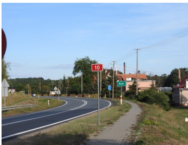
Zdjęcie nr 2 – wjazd do miejscowości – droga krajowa nr 10

Opracowanie Sołeckiej Strategii Rozwoju było skutkiem przeprowadzenia dwudniowych warsztatów , które poprzedzone zostały wizytacją miejscowości przez moderatorów.