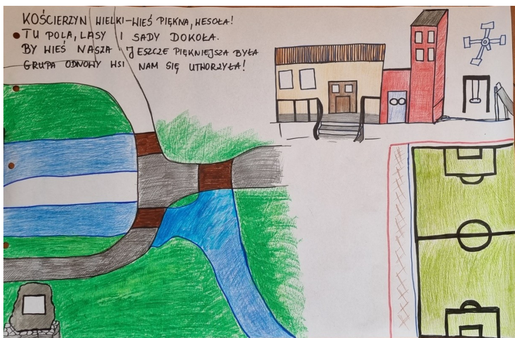
Zdjęcie 20 Wizja obrazkowa miejscowości wykonana podczas warsztatów przez Przedstawicieli GOW

miejscem, przy którym obchodzone są najważniejsze historycznie daty. Plac zabaw, który niegdyś świecił pustkami dziś tętni życiem. Gospodarstwa rolne i sady dzięki pozyskanym funduszom zewnętrznym stały się nowoczesne i konkurencyjne na rynkach zbytu, a zakupione maszyny ułatwiają wszystkim pracę. Wieś cały czas się rozwija!