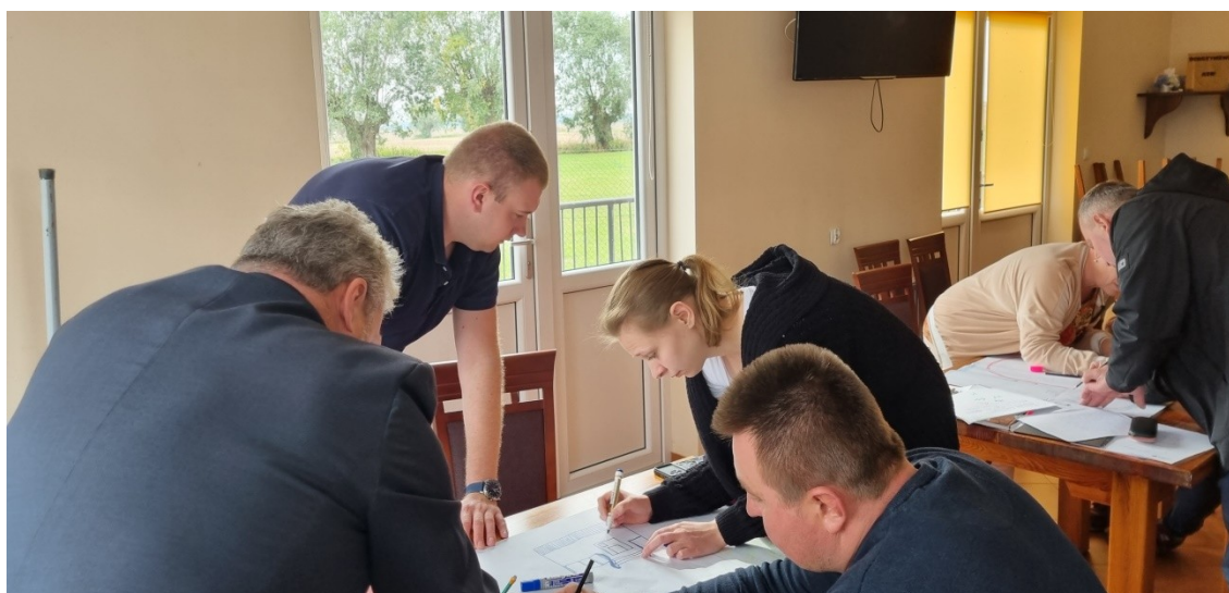
Zdjęcie 21 Praca przedstawicieli GOW nad stworzeniem wizji obrazkowej