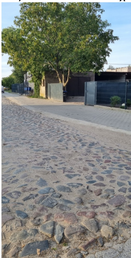
Zdjęcie nr 18 – Odcinek zachowanej drogi kamiennej