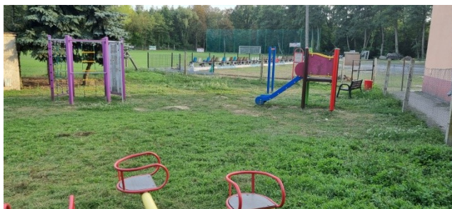
Zdjęcie nr 10 – Plac zabaw