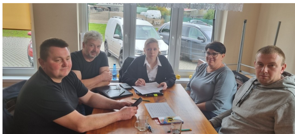
Zdjęcie nr 4 – Praca grupy podczas drugiego dnia warsztatów

Drugiego dnia warsztatów mieszkańcy zobowiązani byli wskazać, na podstawie przeprowadzonych wcześniejszych analiz w poszczególnych obszarach rozwojowych sołectwa, planowane zamierzenia projektowe. Tak powstał plan długi i krótkoterminowy rozwoju sołectwa Kościerzyn Wielki na najbliższy rok i 5-lat. W planie krótkoterminowym wskazano te projekty/zadania, które mieszkańcy sołectwa planują zrealizować w pierwszej kolejności – w okresie 12 miesięcy. Następnie w ramach planu długoterminowego zaplanowano zadania na lata przyszłe. W planie długoterminowym wskazano cele jakie sołectwo określiło dla realizacji Wizji Rozwoju Sołectwa . Cele zostały postawione w poszczególnych obszarach interwencji, które Grupa Odnowy Wsi postanowiła osiągnąć poprzez realizację zadań i projektów zapisanych w planie długoterminowym i programie krótkoterminowym.