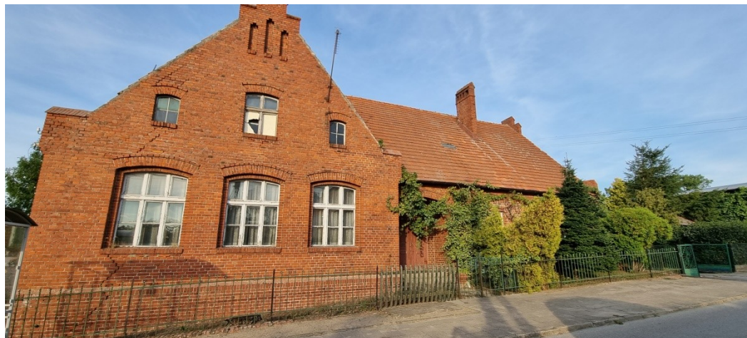
Zdjęcie nr 6 –Centrum miejscowości – charakterystyczne zbudowania z czerwonej cegły

Koło Gospodyń Wiejskich dużą wagę przywiązuje do dziedzictwa lokalnego, posiada tradycyjne stroje z elementami haftu krajeńskiego, gotuje tradycyjne potrawy, pokazuje jak piękne są tradycje naszego regionu. Ich osiągnięcia to m.in.: