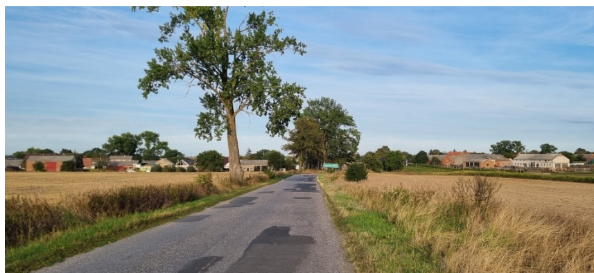
Zdjęcie nr 7 – droga dojazdowa do miejscowości

Z ważniejszych zabytków we wsi- pomnik poległych w latach 1939-45 mieszkańców wsi, wiele zabytkowych drzew oraz domów, przepiękny Dwór Hercowo (XIX wieczny dworek, który został przepięknie odrestaurowany. Wnętrza dworu to stylowo urządzone pokoje, które umożliwiają wspaniałą wypoczynek i relaks, w piwnicach znajduje się restauracja, serwująca smaczne potrawy kuchni polskiej).