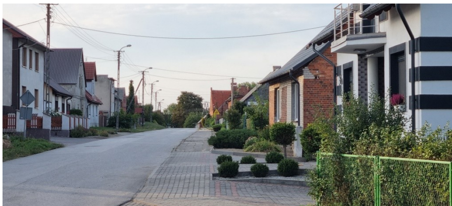
Zdjęcie nr 2 – Zabudowania przy drodze w miejscowości

Opracowanie Sołeckiej Strategii Rozwoju było skutkiem przeprowadzenia dwudniowych warsztatów , które poprzedzone zostały wizytacją miejscowości przez moderatorów.