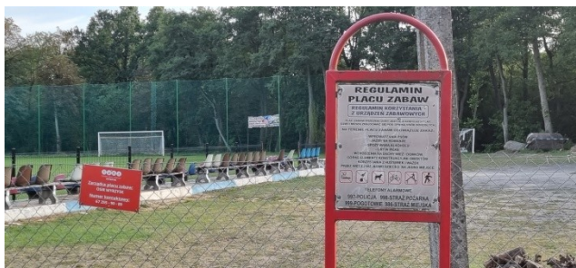
Zdjęcie nr 11 – Tablica informacyjna przy placu zabaw