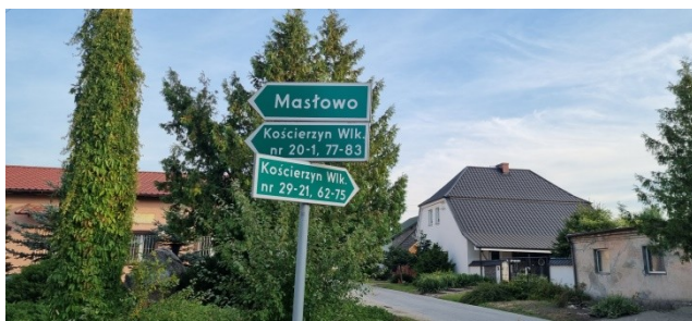
Zdjęcie nr 13 – Oznakowanie pionowe na terenie sołectwa