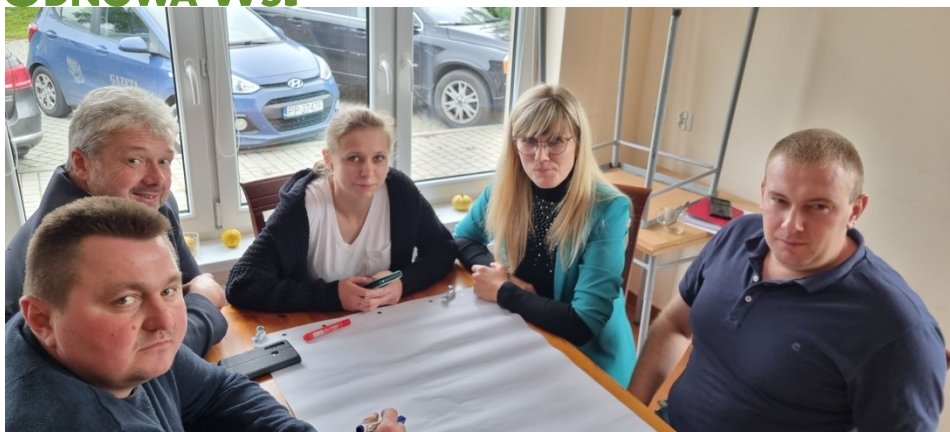
Zdjęcie nr 3 – Praca grupy podczas pierwszego dnia warsztatów