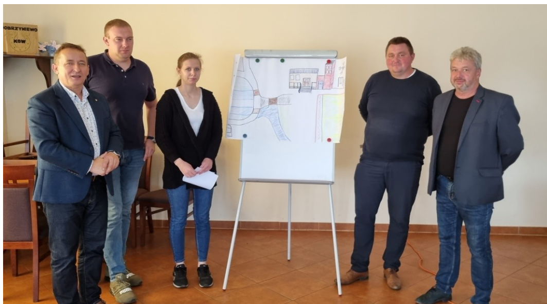
Zdjęcie 19 Prezentacja wizji obrazkowej miejscowości