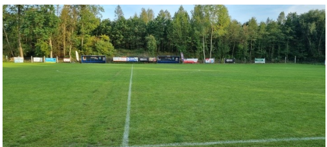
Zdjęcie nr 14 – Boisko sportowe