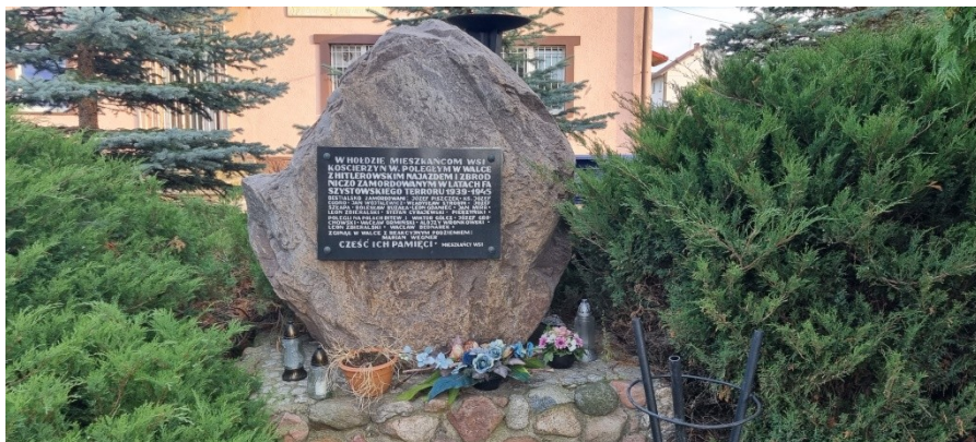
Zdjęcie nr 5 –Charakterystyczny kamień upamiętniający wydarzenia historyczne

Kościerzyn Wielki- położony w Gminie Wyrzysk, powiecie pilskim, w województwie wielkopolskim. Sołectwo składa się z dwóch wsi- Kościerzyn Wielki i Maśłowo. Razem liczą około 400 mieszkańców. Kościerzyn Wielki to piękna, zielona wieś i chociaż jest podzielona na różne sposoby to jej jedność i zaangażowanie na rzecz mieszkańców może być wzorem dla okolicy. Przez środek wsi biegnie rzeka Łobżonka, ona dzieli wieś na dwie parafie- Glesno i Gromadno. Wieś podzielona jest także na części: tak zwane Hercowo, Gaj i Pinki. Malownicze koryto rzeki przegradzone jest zaporą i jazem przy młynie z elektrownią wodną. Głównym motorem napędowym elektrowni jest oryginalna turbina wodna Francisa z 1888 roku . Właśnie obok elektrowni wodnej znajduje się miejsce znane wszystkim mieszkańcom wsi i okolic. Jest tam świetlica wiejska, teren wokół świetlicy i boisko sportowe. To tam organizowane są liczne festyny, turnieje piłkarskie, czy pikniki rodzinne. Jest to centrum wszystkich aktywności.