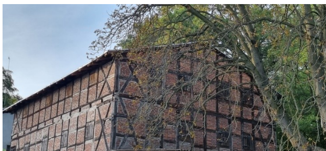
Zdjęcie nr 12 – Zabytkowy prywatny budynek