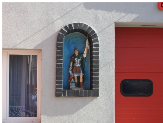
Zdjęcie nr 7 – św. Florian na budynku OSP w Gromadnie

W centrum wsi znajduje się miejsce rekreacji, sportu i zabawy dla dzieci. Mieszkańcy Gromadna przy okazji organizacji różnych uroczystości chętnie udzielają się społecznie. Warto wspomnieć, że wieś jest zadbana i czysta, gdyż mieszkańcy dokładają wszelkich starań, aby posesja każdego z nas była uporządkowana i piękna.