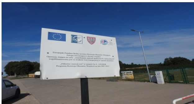
Zdjęcie nr 13 – Tablica promująca otrzymane dofinansowanie