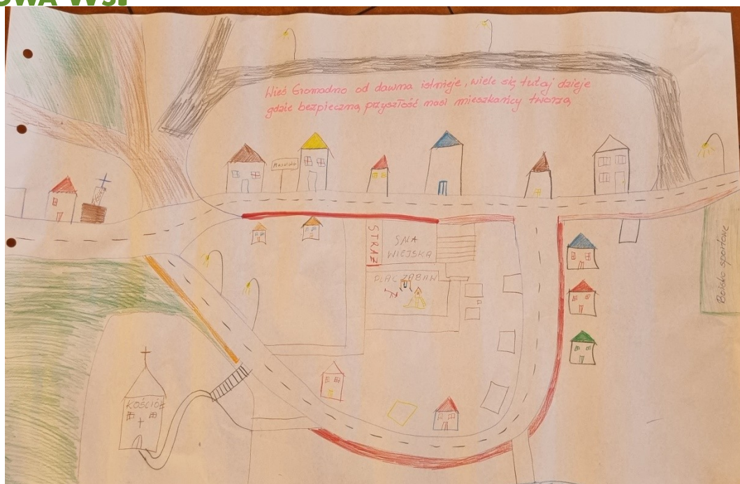
Zdjęcie 20 Wizja obrazkowa miejscowości wykonana podczas warsztatów przez Przedstawicieli GOW