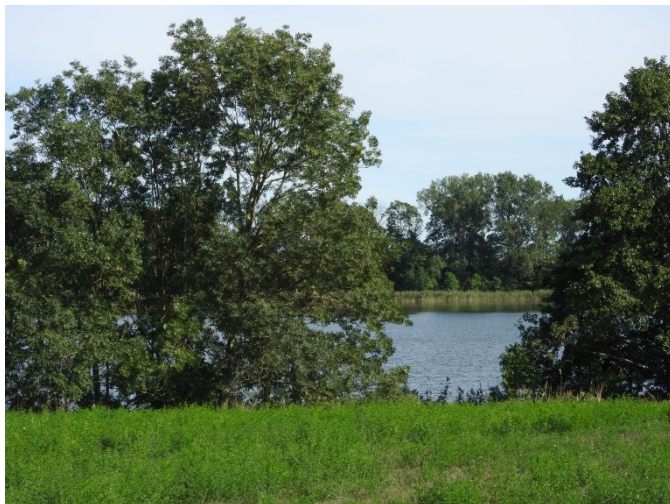
Zdjęcie nr 5 – Jezioro Falmierowskie na terenie sołectwa

Zamieszkała przez 355 mieszkańców. Na drodze dojazdowej mieści się figura świętego Jana Nepomucena. Charakterystycznym punktem sołectwa jest Figura Krzyża na rozdrożu dróg. Mamy cmentarz z 1926 roku oraz kościół w stylu neogotyckim.