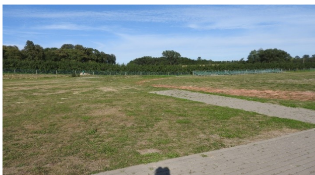
Zdjęcie nr 9 – Boisko sportowe