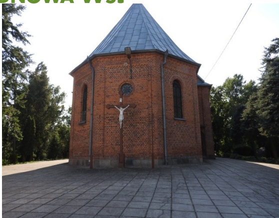
Zdjęcie nr 16 – Krzyż przydrożny