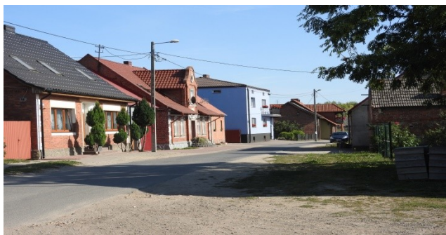
Zdjęcie nr 12 – Zwarta zabudowa na terenie sołectwa