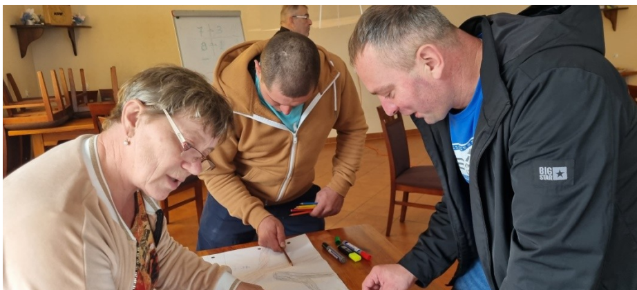
Zdjęcie nr 3 – Praca grupy podczas pierwszego dnia warsztatów

Pierwszego dnia warsztatów członkowie grupy pracowali nad określeniem analizy zasobów . Na podstawie tego dokumentu wskazywali elementy, które oceniają jako silne strony sołectwa i słabe – wymagające zmiany. Wskazywali również na to, jakie szanse i zagrożenia płyną z otoczenia zewnętrznego, które mogą zostać wykorzystane lub ograniczać rozwój sołectwa. W ten sposób przeprowadzono analizę SWOT - analizę, która identyfikuje i wskazuje silne i słabe strony sołectwa, oraz szanse i zagrożenia jakie mają oddziaływanie na sołectwo. Analiza ta uwzględniała poprzedni dokument, który obecnie uległ modyfikacji ze względu na realizację wcześniej zaplanowanych zadań i powstałych nowych oczekiwań mieszkańców do sytuacji panującej obecnie w sołectwie. Każda z wykazanych, obecnie występujących cech, została przypisana do jednego z obszarów potencjału rozwojowego. Są to: Standard życia, Jakość życia, Tożsamość wsi i wartości życia wiejskiego, a także Byt. Uczestnicy warsztatów przeprowadzili również analizę potencjału rozwojowego . Pozwoliło to wskazać najważniejsze cele ogólne oraz zaplanować rozwój tak, aby był on równomierny i wykorzystywał wszystkie obszary interwencji. Finalnie Grupa Odnowy Wsi wskazała wizję hasłową i wizję opisową sołectwa.