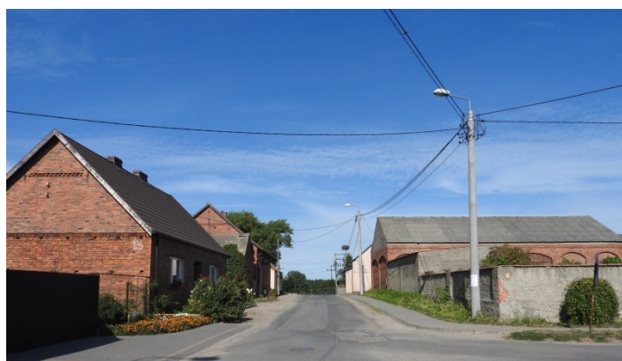
Zdjęcie nr 2 – Zabudowania przy drodze w miejscowości

Opracowanie Sołeckiej Strategii Rozwoju było skutkiem przeprowadzenia dwudniowych warsztatów , które poprzedzone zostały wizytacją miejscowości przez moderatorów.