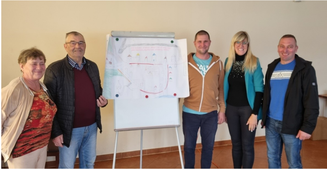
Zdjęcie 19 Prezentacja wizji obrazkowej miejscowości