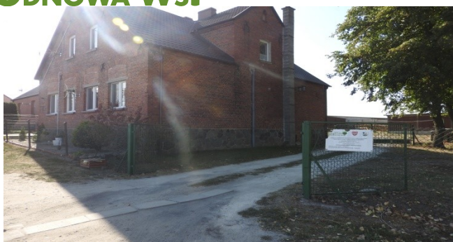
Zdjęcie nr 8 – Sala wiejska w miejscowości