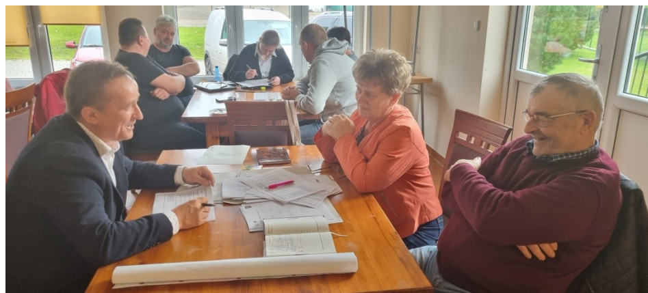
Zdjęcie nr 4 – Praca grupy podczas drugiego dnia warsztatów