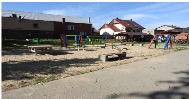
Zdjęcie nr 10 – Plac zabaw