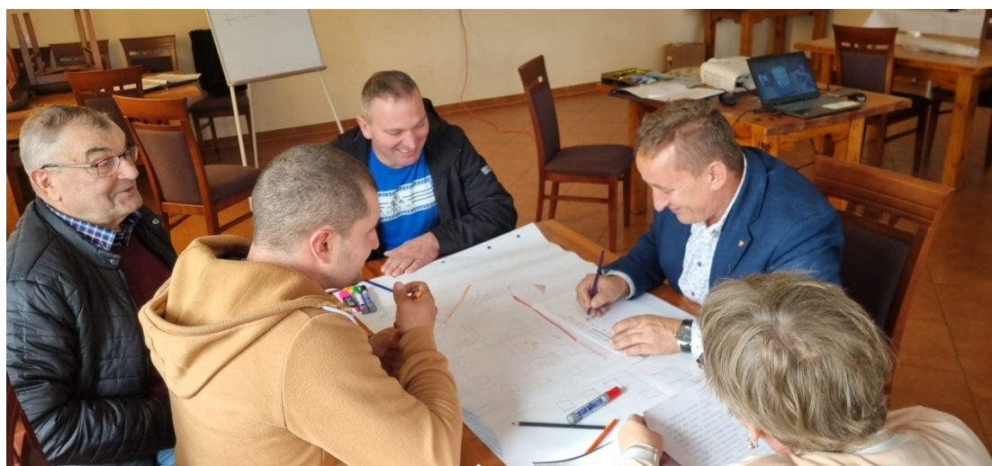
Zdjęcie 21 Praca przedstawicieli GOW nad stworzeniem wizji obrazkowe