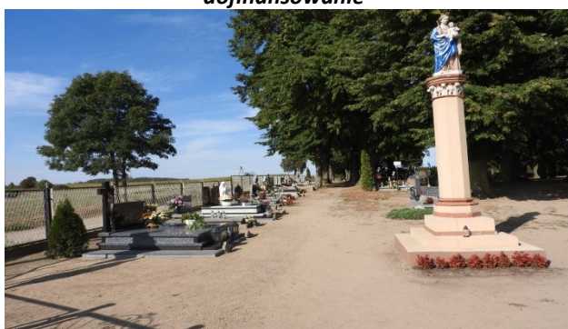
Zdjęcie nr 15 – Figura na cmentarzu parafialnym