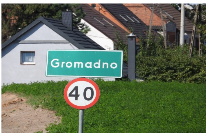
Zdjęcie nr 1 – Wjazd do miejscowości