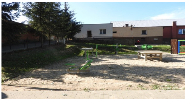
Zdjęcie nr 11 – Urządzenia siłowni zewnętrznej