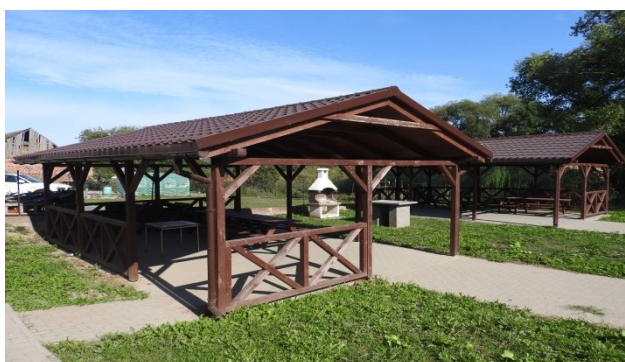
Zdjęcie nr 14 – Wiaty integracyjne