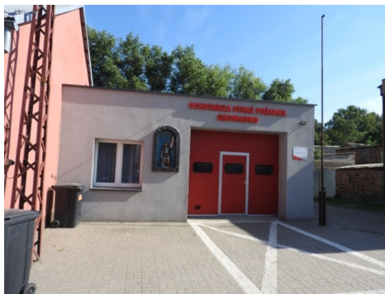
Zdjęcie nr 6 – Ochotnicza Straż Pożarna w Gromadnie

W centrum wsi znajduje się miejsce rekreacji, sportu i zabawy dla dzieci. Mieszkańcy Gromadna przy okazji organizacji różnych uroczystości chętnie udzielają się społecznie. Warto wspomnieć, że wieś jest zadbana i czysta, gdyż mieszkańcy dokładają wszelkich starań, aby posesja każdego z nas była uporządkowana i piękna.