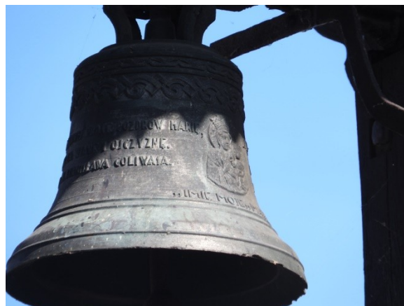
Zdjęcie nr 17 – Krzyż przydrożny