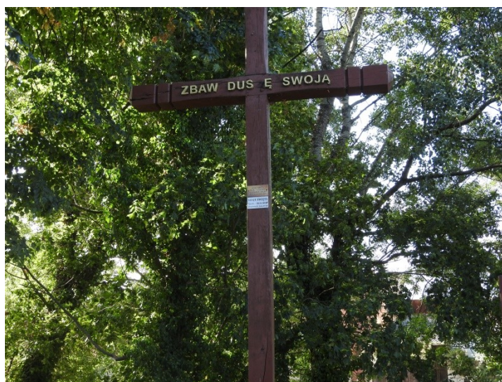
Zdjęcie nr 8 – Jeden z obiektów kultu religijnego - krzyż