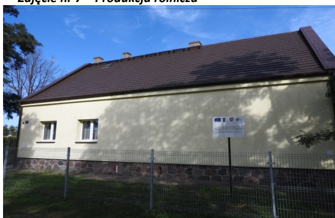
Zdjęcie nr 9 – Budynek świetlicy wiejskiej