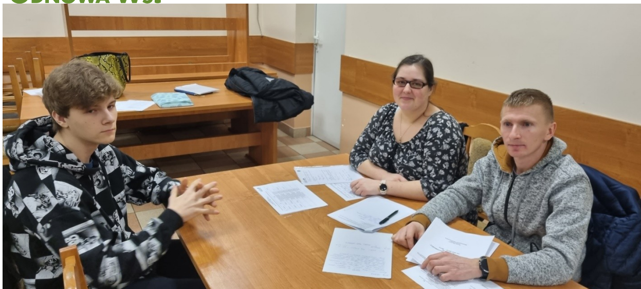
Zdjęcie nr 4 – Praca grupy podczas drugiego dnia warsztatów

Drugiego dnia warsztatów mieszkańcy zobowiązani byli wskazać, na podstawie przeprowadzonych wcześniejszych analiz w poszczególnych obszarach rozwojowych sołectwa, planowane zamierzenia projektowe. Tak powstał plan dłu­go i krótkoterminowy rozwoju sołectwa Auguścín na najbliższy rok i 5-lat. W planie krótkoterminowym wskazano te projekty/zadania, które mieszkańcy sołectwa planują zrealizować w pierwszej kolejności – w okresie 12 miesięcy. Następnie w ramach planu dłu­goterminowego zaplanowano zadania na lata przyszłe. W planie dłu­goterminowym wskazano cele jakie sołectwo określiło dla realizacji Wizji Rozwoju Sołectwa . Cele zostały postawione w poszczególnych obszarach interwencji, które Grupa Odnowy Wsi postanowiła osiągnąć poprzez realizację zadań i projektów zapisanych w planie dłu­goterminowym i programie krótkoterminowym.