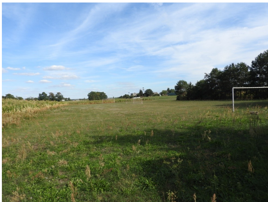
Zdjęcie nr 5 – Teren boiska sportowego