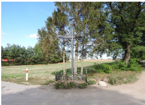
Zdjęcie nr 13 – Krzyż przydrożny