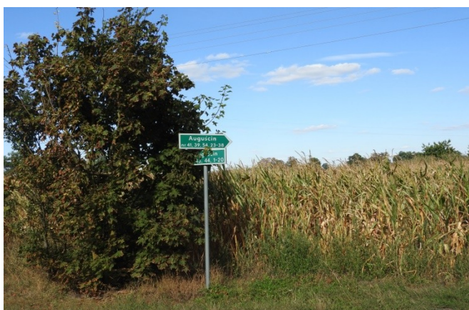
Zdjęcie nr 14 – Oznakowanie dojazdu do posesji