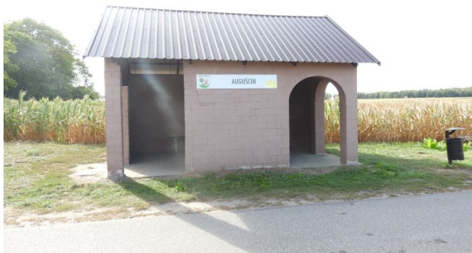
Zdjęcie nr 8 – Przystanek autobusowy