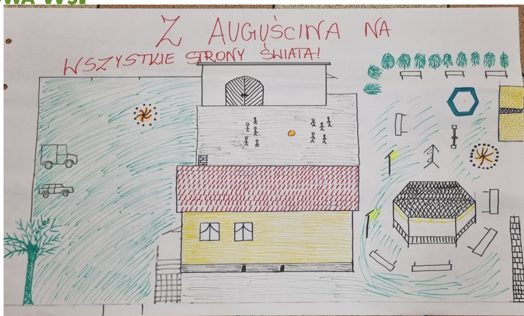
Zdjęcie 17 Wizja obrazkowa miejscowości wykonana podczas warsztatów przez Przedstawicieli GOW