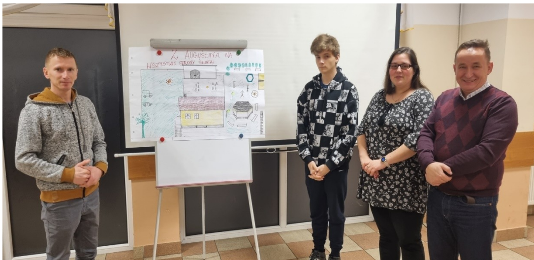
Zdjęcie 16 Prezentacja wizji obrazkowej miejscowości