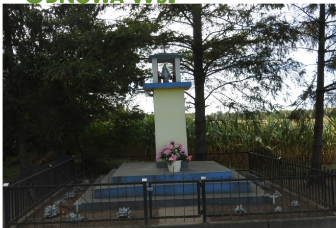
Zdjęcie nr 12 – Kapliczka przydrożna