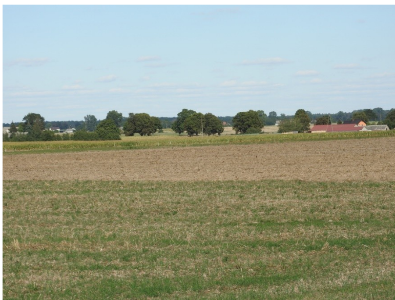
Zdjęcie nr 2 – Panorama miejscowości – charakter rolniczy