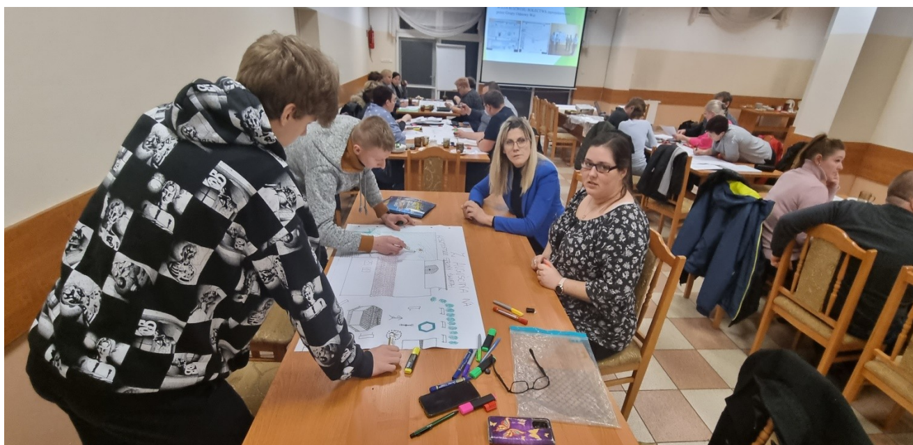
Zdjęcie 18 Praca nad przygotowaniem wizji obrazkowej