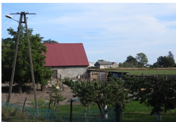
Zdjęcie nr 15 – Zabudowania