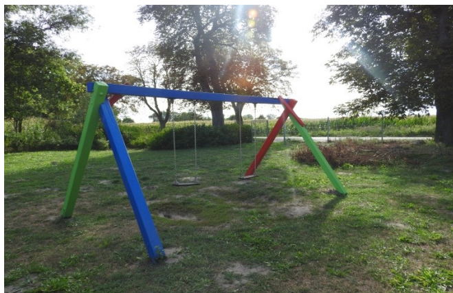
Zdjęcie nr 11 – Urządzenia placu zabaw na terenie rekreacyjnym