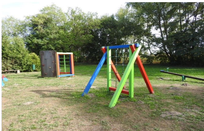
Zdjęcie nr 10 Urządzenia placu zabaw na terenie rekreacyjnym