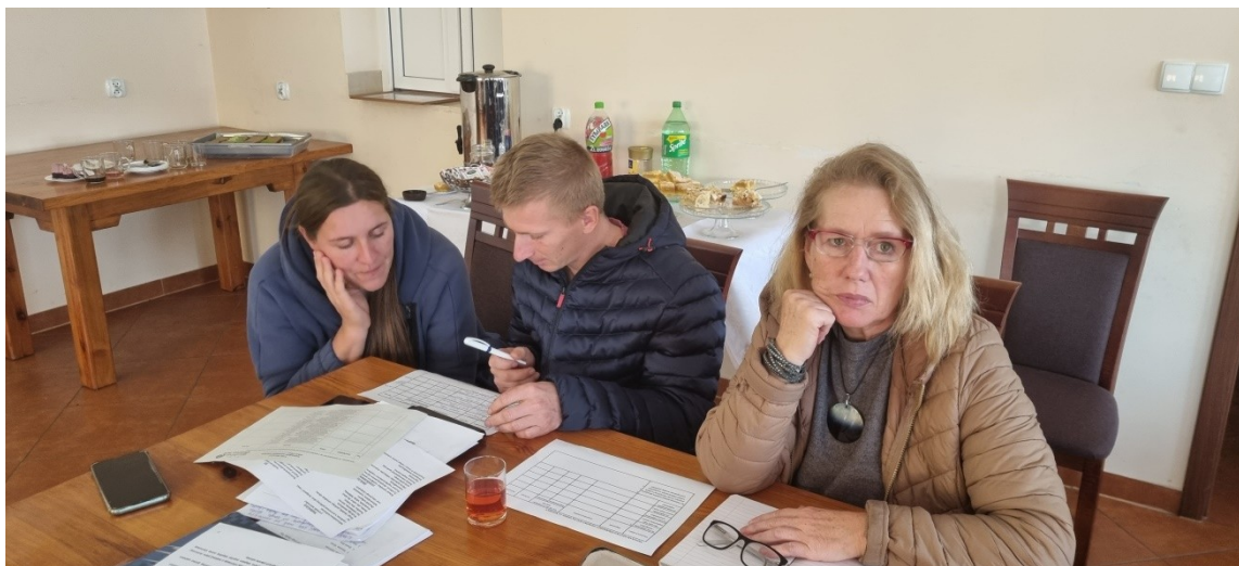
Zdjęcie nr 3 – Praca grupy podczas pierwszego dnia warsztatów

Pierwszego dnia warsztatów członkowie grupy pracowali nad określeniem analizy zasobów . Na podstawie tego dokumentu wskazywali elementy, które oceniają jako silne strony sołectwa i słabe – wymagające zmiany. Wskazywali również na to, jakie szanse i zagrożenia płyną z otoczenia zewnętrznego, które mogą zostać wykorzystane lub ograniczać rozwój sołectwa. W ten sposób przeprowadzono analizę SWOT - analizę, która identyfikuje i wskazuje silne i słabe strony sołectwa, oraz szanse i zagrożenia jakie mają oddziaływanie na sołectwo. Każda z wykazanych, obecnie występujących cech, została przypisana do jednego z obszarów potencjału rozwojowego. Są to: Standard życia, Jakość życia, Tożsamość wsi i wartości życia wiejskiego, a także Byt. Uczestnicy warsztatów przeprowadzili również analizę potencjału rozwojowego . Pozwoliło to wskazać najważniejsze cele ogólne oraz zaplanować rozwój tak, aby był on równomierny i wykorzystywał wszystkie obszary interwencji. Finalnie Grupa Odnowy Wsi wskazała wizję hasłową i wizję opisową sołectwa.