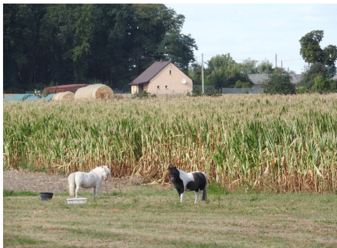
Zdjęcie nr 7 – Produkcja rolnicza