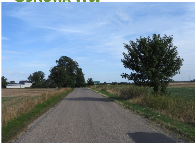
Zdjęcie nr 6 – Droga dojazdowa