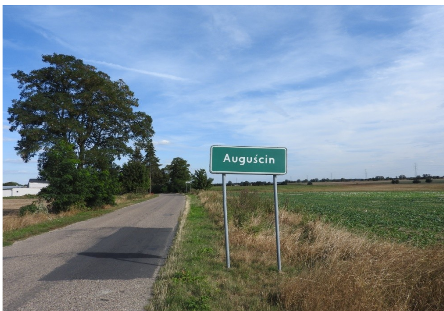
Zdjęcie nr 1 – Wjazd do miejscowości