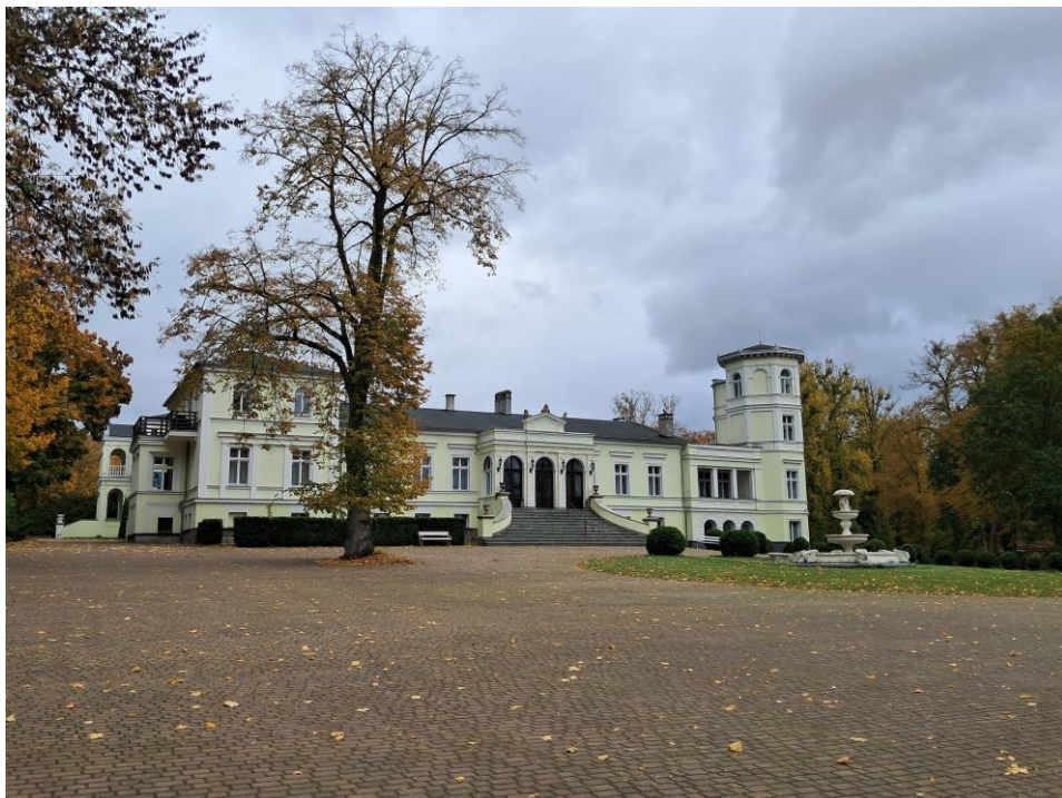
Pałac w Rzęszkowie