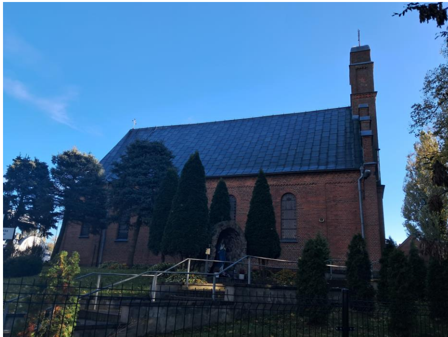
Kościół parafialny p.w. św. Jakuba Większego w Gromadnie