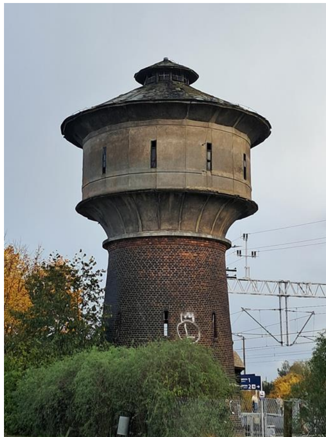
Wieża ciśnień w zespole stacji kolejowej w Osieku nad Notecią