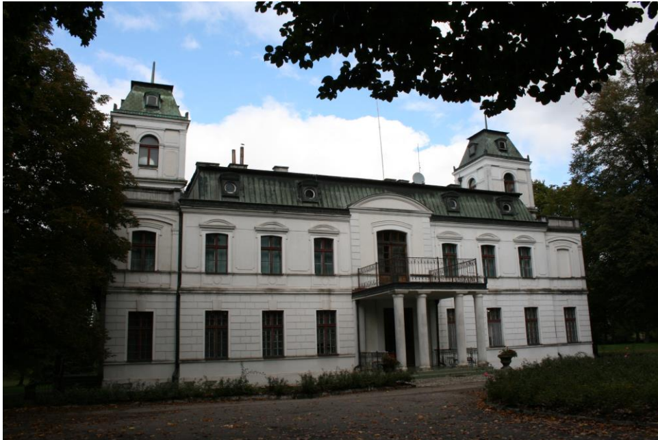
Pałac w Dąbkach