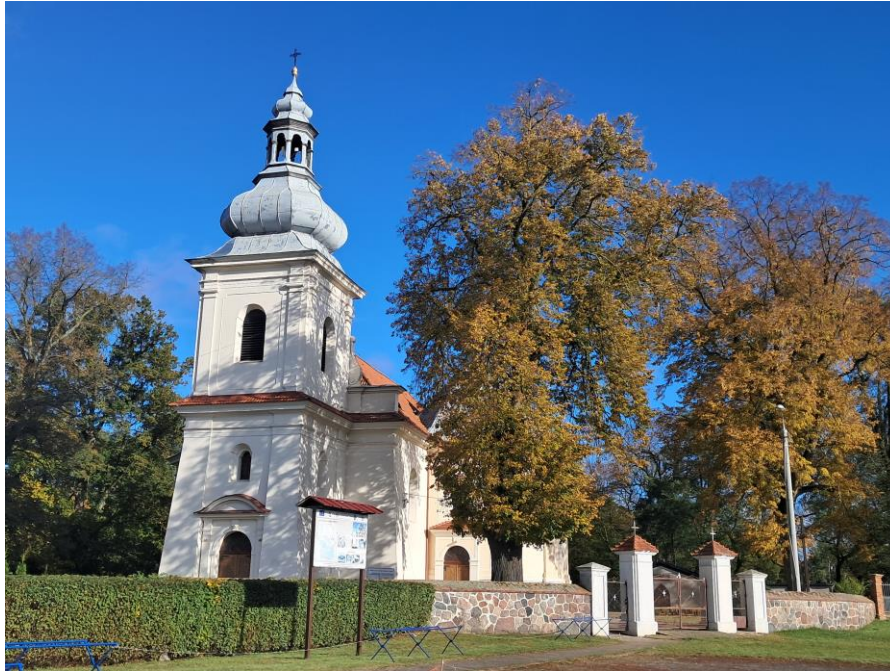
Kościół parafialny p.w. św. Jadwigi w Gleśnie