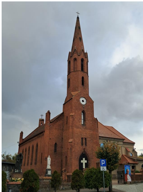
Kościół parafialny p.w. św. Marcina Bpa w Wyrzysku