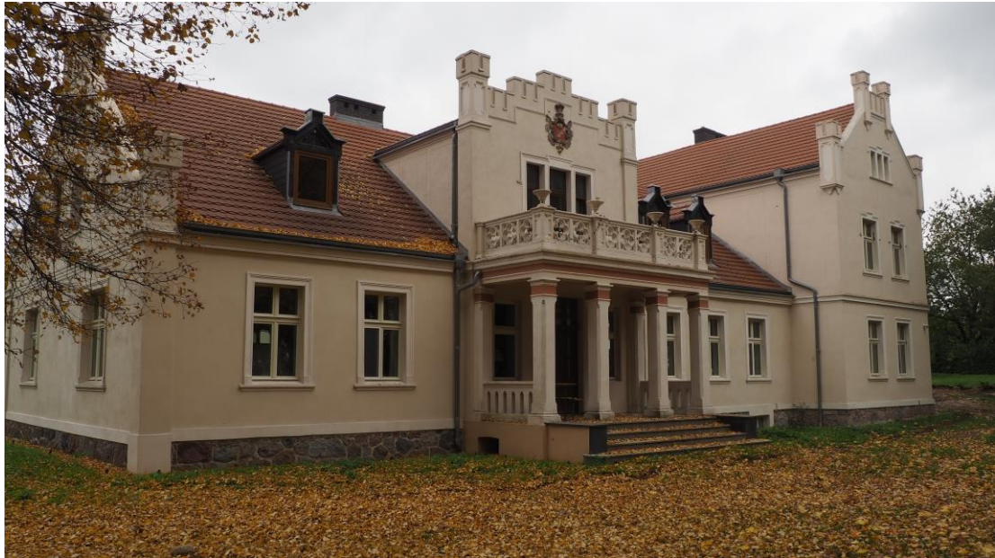
Dwór w Bagdadzie