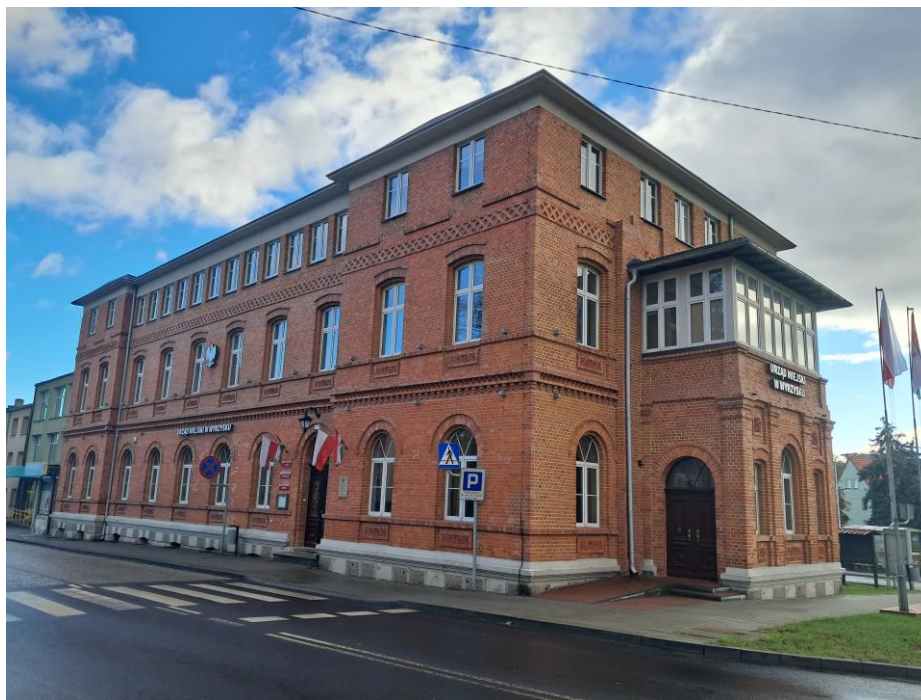
Urząd Miejski, d. Starostwo Powiatowe w Wyrzysku