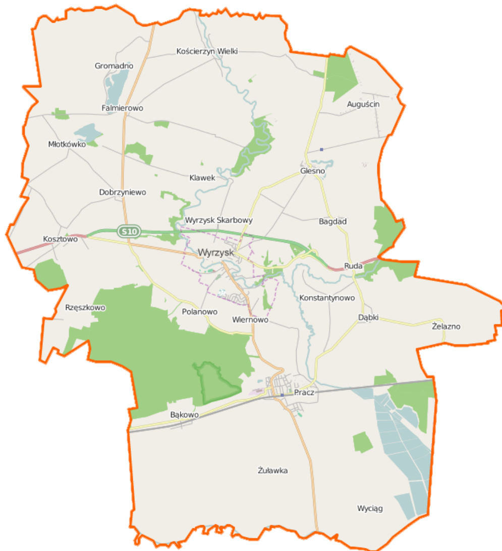
Mapa gminy Wyrzysk

na południowym skraju Pojezierza Południowokrajeńskiego – Dębowa Góra o wysokości 192 m. n.p.m. Większą część, tj. 73% powierzchni gminy zajmują grunty rolne, natomiast 12% stanowią lasy (głównie mieszane z przewagą sosny, dębu, świerku i jodły oraz bory i olsy).