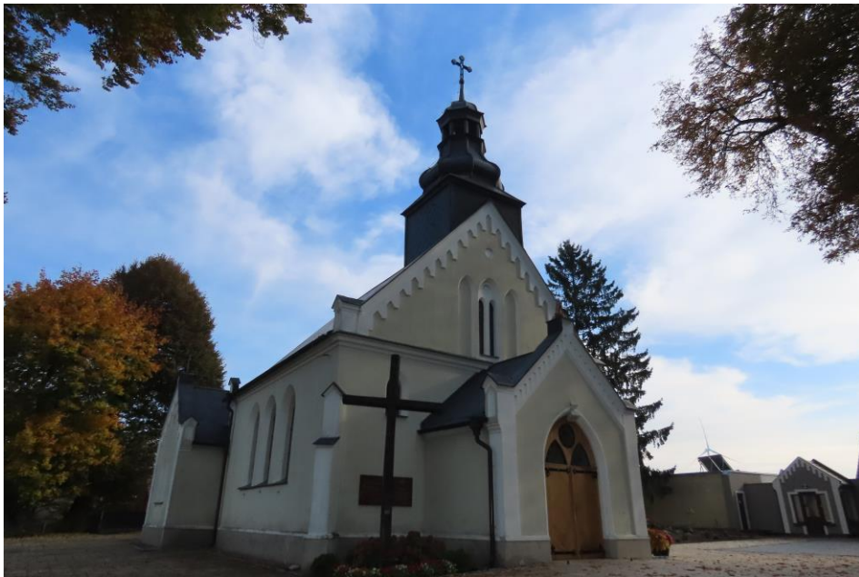
Kosztowo, kościół parafialny p.w. św. Anny